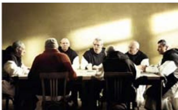
I Gudar och människor , som utspelar sig i inbördeskrigets Algeriet, ställs en grupp munkar inför ett svårt val.

Gudar och människor tar oss med till 1990-talets Algeriet och ett land på gränsen till inbördeskrig. I ett kloster i bergen i Maghreb lever åtta franska munkar i nära kontakt med sina muslimska bröder och systrar. När oroligheterna närmar sig deras trakter står de inför ett svårt val: stanna kvar som stöd för det lilla samhället kring klostret som verkligen behöver dem, men då riskera att dö martyrdöden, eller resa bort och rädda sina liv. Valet är