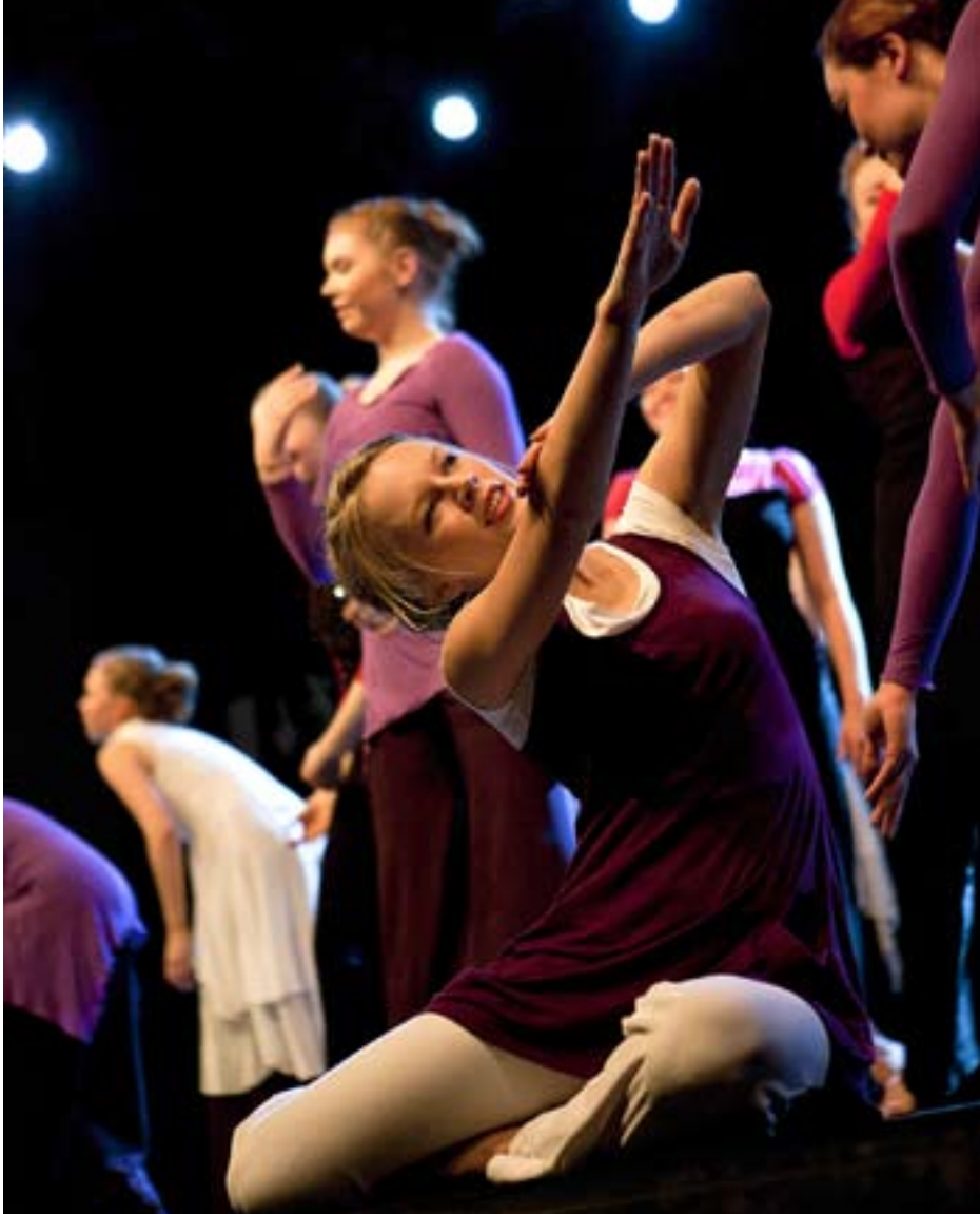
Xaris Dance Finland har uppträtt i många kyrkor och bland annat på Nordens största kristna ungdomsfestival "Maata näkyvissä" i Åbo. En annan samarbetspartner är Finska Missionssällskapet.

När målet är klart arbetar gruppen fram en dansproduktion och under halvannan månad både övar man in produktionen och gör en turné med kanske ett femtontal föreställningar.