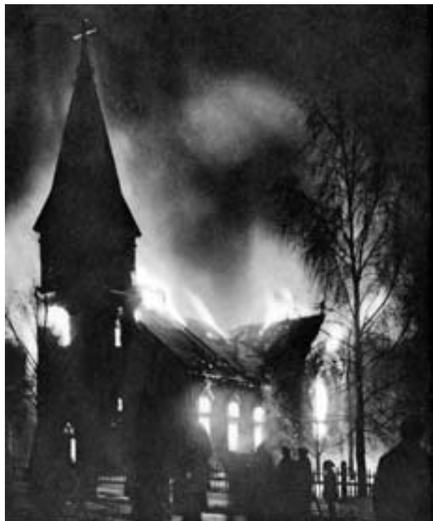
Jyväskylä landsbygdsförsamlings kyrka brann i en olycka just före kriget. Den brinnande kyrkan fanns med i Jyväskylä skyddskårs flagga. Den blev en symbol för de hårda tider som kom.