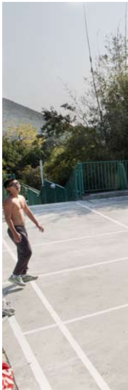
Livet på Ling Oi är disciplinerat. Bland

Ketamin introducerades för tio år sedan. Först var ketamin bara en partydrog men numera tas den på daglig basis, också i skolorna.