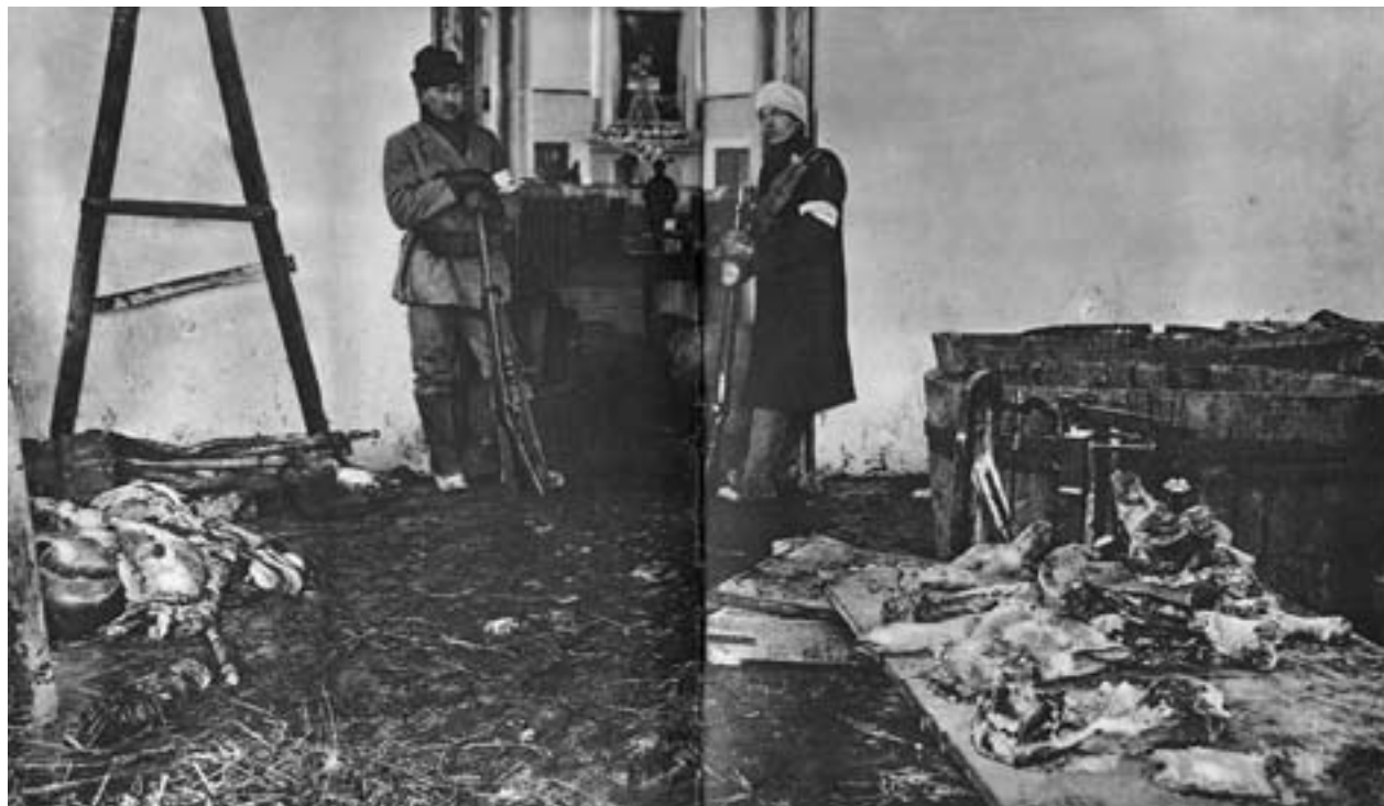
Leppävirta kyrka som de röda använde som kasern. De vita tyckte att de röda hade ohelgat kyrkan.

De vita kände att de försvarade den lagliga samhällsordningen och den grundlagsenliga kontinuiteten. Kanske kan man i begreppet "överhet" också läsa in en klassdimension. Eftersom överheten upplevdes som "laglig" var det också nödvändigt och tillåtet att straffa dem som satte sig upp mot dem som styrde.