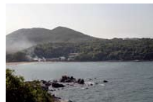
Det finns inga bilvägar till Ling Ois drogrehabiliteringscenter. Det gamla centret låg i fiskarbyn nere vid stranden. Det nya ligger uppe på kullen till höger.

annat bibelläsning, skolutbildning och idrottsaktiviteter finns på schemat.