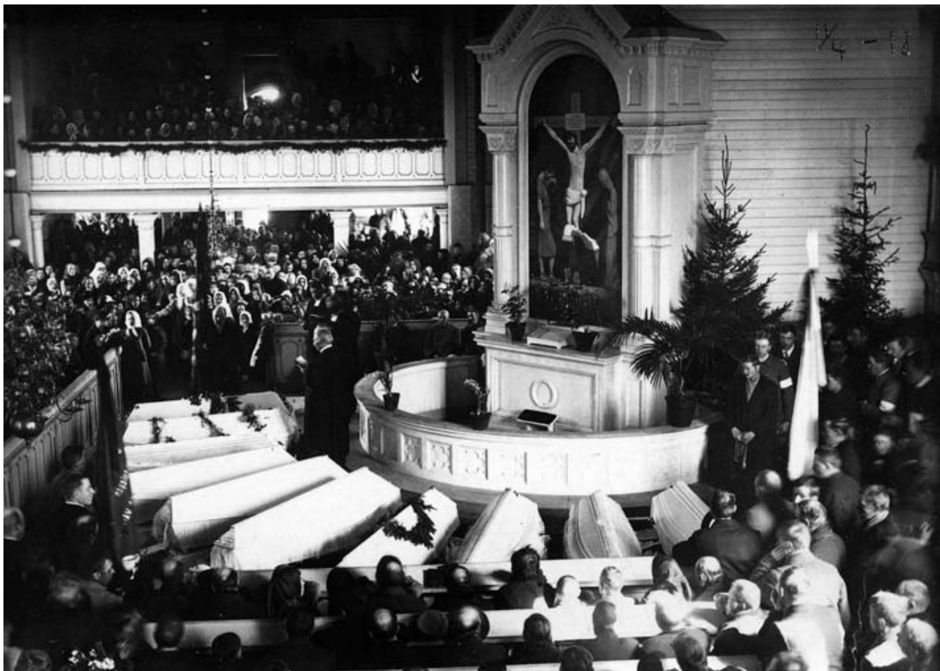
Hjältebegravning i Kauhajoki efter erövringen av Tammerfors 1918.