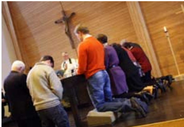
Petrus församling i Helisingfors välsignade sina förtroendevalda i en festgudstjänst i Månas kyrka förra söndagen.

– Vi borde renovera församlingshemmet men det finns inte pengar eftersom vi har en minusbudget för