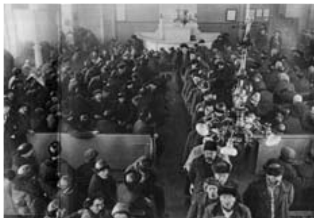
Varkaus fabrikskyrka som de vita använde som fängelse.