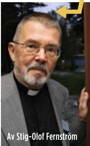
Av Stig-Olof Fernström

så grym och tron på honom direkt skadlig? Om Han inte finns och alltså inte har uppenbarat sig i Bibeln, är Han skapad av människan. Vad bevisar detta i så fall om människan?