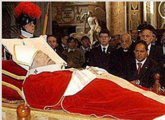
Johannes Paulus II på lit de parade.

Vatikanen meddelade förra veckan att förre påven Johannes Paulus II kommer att saligförklaras vid en ceremoni 1 maj i år. Beatifikationen, som är den romersk-katolska kyrkans sista steg före helgonförklaring, har godkänts av påve Benedikt XVI.