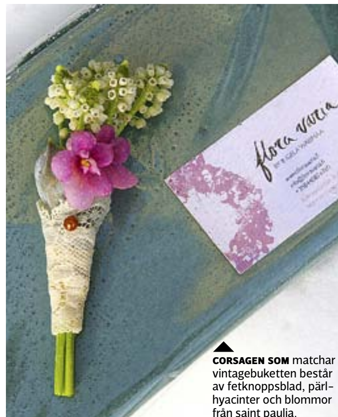
▲ CORSAGEN SOM matchar vintagebuketten består av fetknopsblad, pärlhyacinter och blommor från saint paulia.