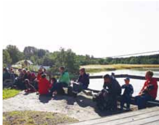
HUNDLÄGRET AVSLUTADES med en friluftsgudstjänst vid havet.

Alla deltagare samlades till andakter i samband med morgonmål och kvällsmat. En legend om Franciskus av Assisi som tämjde en vildvarg och blev honom trofast