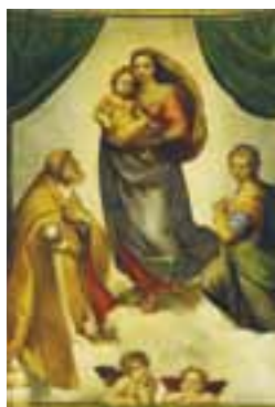
... och Sixtinska Madonnan från Dresden.