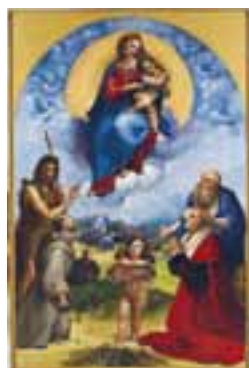
MADONNA av Foligno från Vatikanen till vänster...