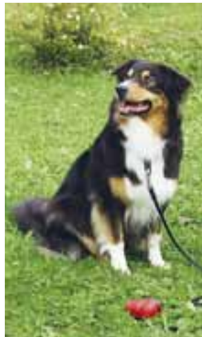
SAMBA TRIVDES bra på lägret.