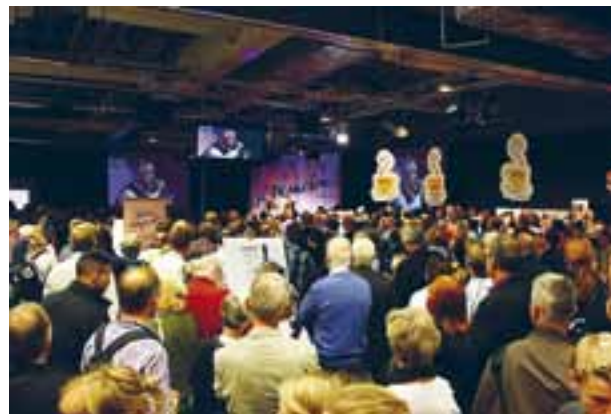
KYRKANS SCEN Se människan på bokmässan i Göteborg är populär bland författare från vitt skilda förlag.