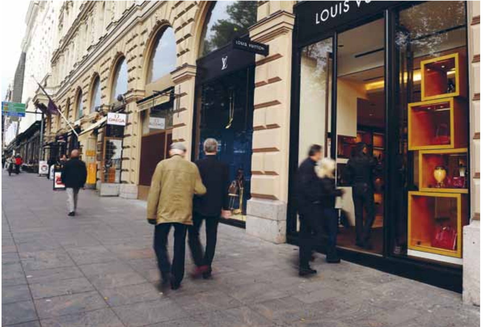
KLYFTORNA MELLAN fattiga och rika växer i Finland. För att nå utjämning efterlyser rättvisekämpar en kapning av överflödet.