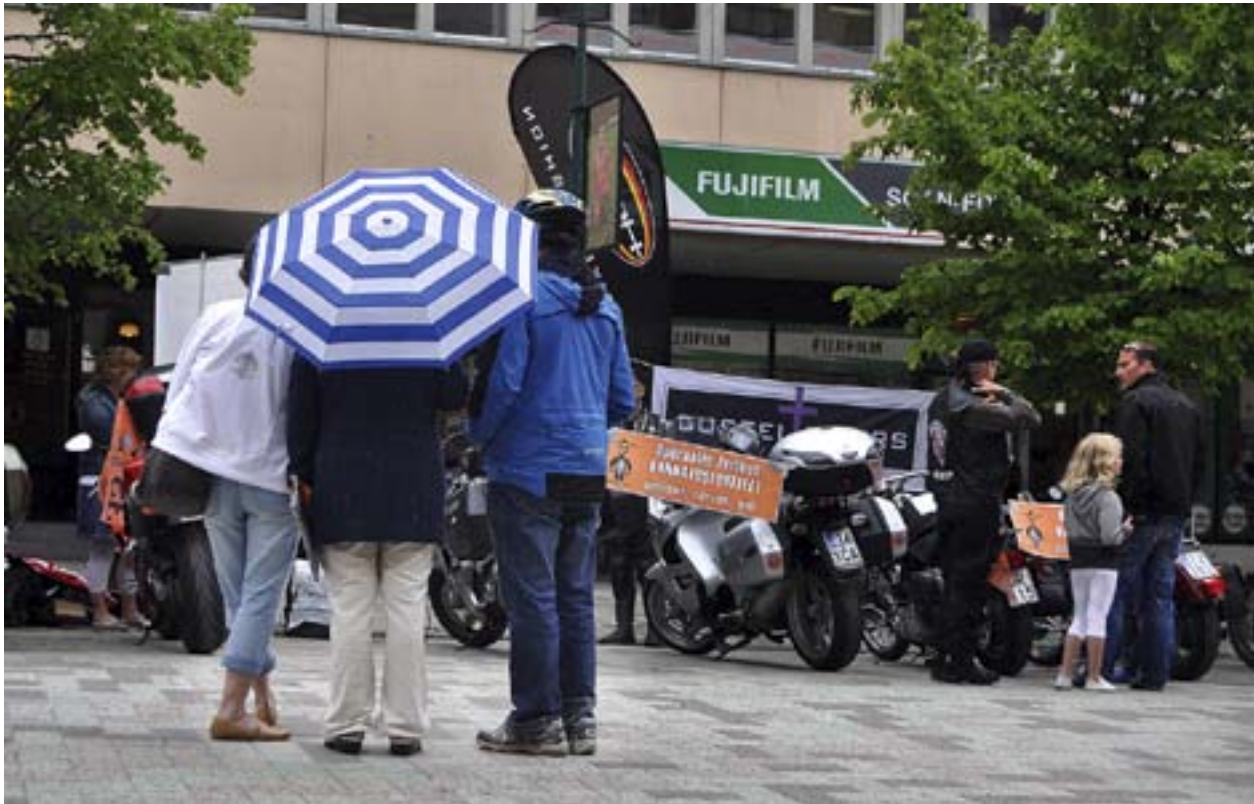
MOTOTRYKLARNA VÄCKER intresse. Så även i Jakobstad.