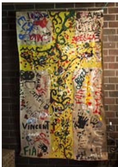
I KAPELLET hänger ett konstverk med allas namn på som skribalgruppen skapat tillsammans.

Efter lunchen följer tre av konfirmanderna med mig ner till bryggan för en pratstund.