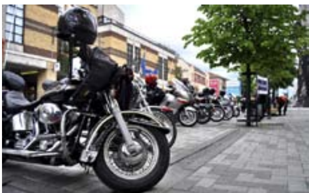
ETT TJUGOTAL motorcyklar deltog då Operation Jeriko nådde Jakobstad.