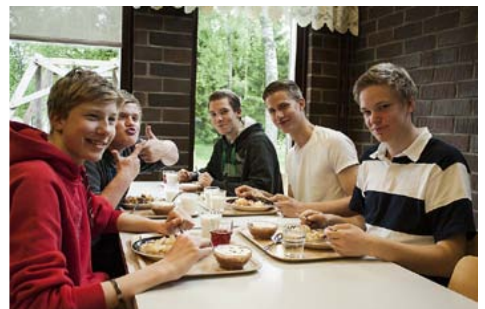
UNDER FÖRMIDDAGENS lektion får konfirmanderna i uppgift att skriva förböner. De tackar Gud för den fina läger tiden och ber för dem som har det svårt. Efter lektionen är det dags för lunch och maten får tummen upp av lägerdeltagarna.