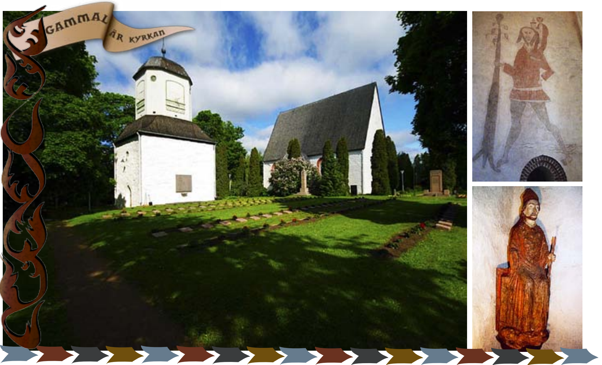
DEN SOM besöker Pyttis kyrka får inte missa Sankt Kristofer i jätteformat eller biskop Henrik med en trängd och ilsken Lalli vid sina fötter.