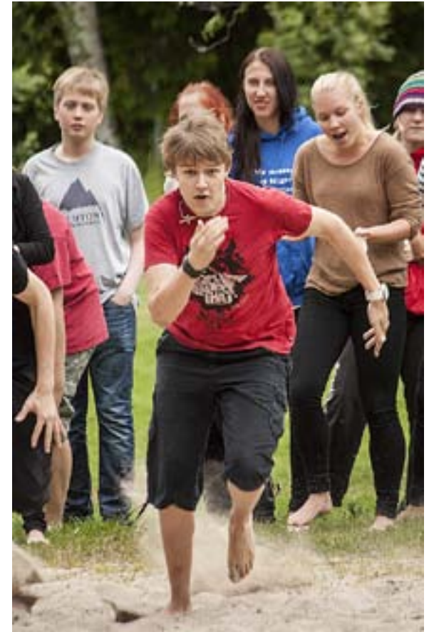
HJÄLPLEDARNA HAR förberett eftermiddagens program som består av olika lekar ute på gräsplanen. Konfirmanderna kämpar om ära och berömmelse i både dragkamp och stafetter.