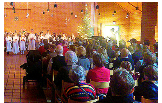
Bilden är tagen under De vackraste julsångerna med Matteus barnkör

till Guds hus för påminna om att man firar jul för att Jesus föddes. Till de vackraste julsångerna kommer också människor som inte är så aktiva kyrkobesökare, säger Sundroos.