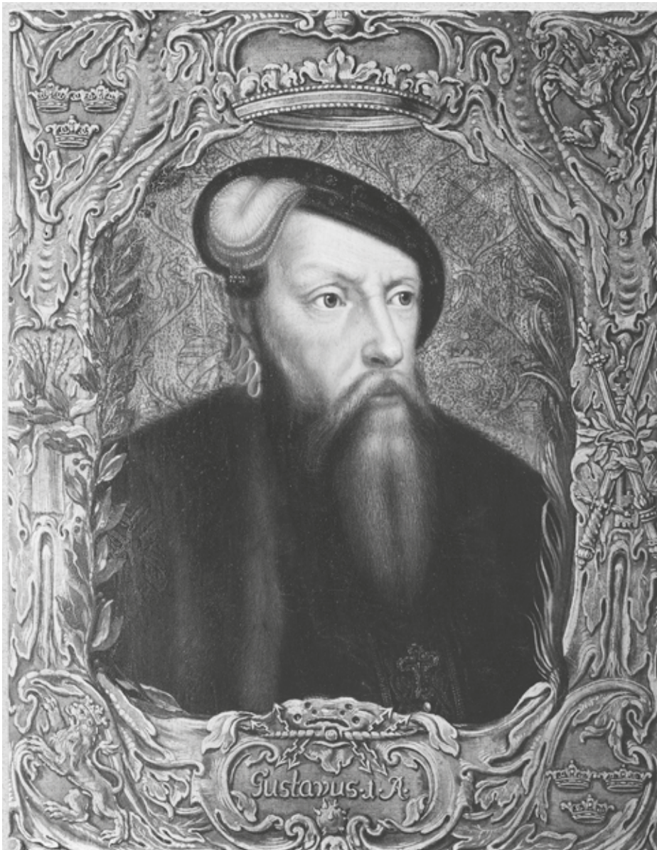
UTAN GUSTAV Vasa ingen reformation? Reformationen kunde inte ha genomförts utan kungamaktens intresse för reformationens sak.