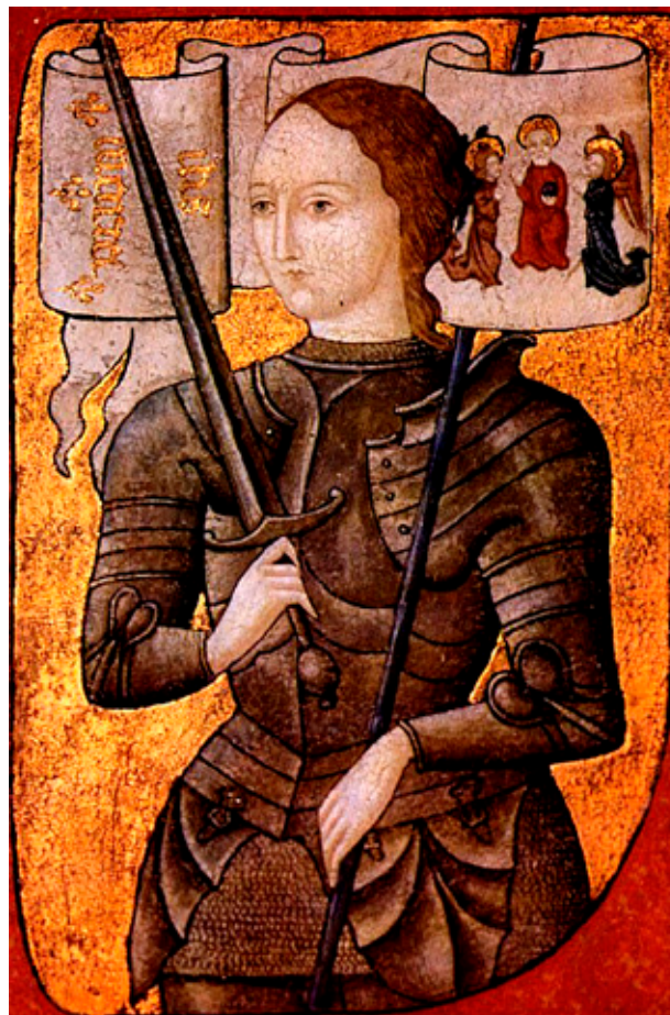
JEANNE D'ARC , född 6 januari 1412 i Domrémy i Lorraine, död 30 maj 1431 i Rouen, är Frankrikes nationalhelgon.

I ytterhögerpartiet Nationella Fronten har de politiska företrädarna Jean-Marie Le Pen och Marine Le Pen i flera år velat använda Nationalhelgonet som symbol. Politiska bedömare menar att Nationella Fronten på