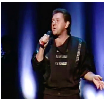
TOMMY KÖRBERG sjöng Stad i ljus i Eurovisionsschlagerfinalen i Dublin.

nerkloster och skrev från morgon till kväll. Det var riktigt roligt och jag lärde mig faktiskt väldigt mycket.