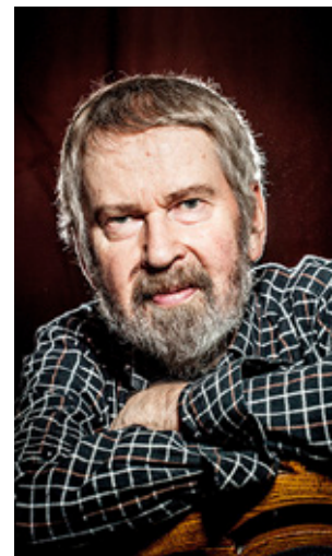
VASAMILJÖERNA är påtagliga i Bäck's diktning.