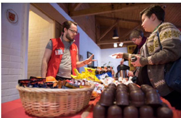
INTÄKTERNA FRÅN Finska Missionsällskapetets café går till att hjälpa utsatta och diskriminerade i Nepal.

– Det är sällan man i vardagen kommer att diskutera såna frågor. Man kanske gör det med sina vänner, men inte