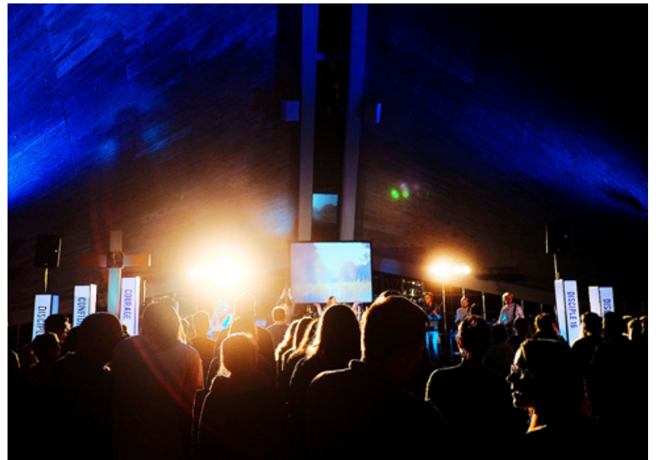
FJOLÅRETS DISCIPLE samlade mycket folk.

TO 18.1: - kl 12.15 startar barnkören i Terjärv skola - kl 18 startar juniorkören i förs.h SÖ 21.1: - kl 10 Högmässa i förs.h, khden, kantorn - kl 18 Gudstjänstgruppsamling i förs.h. Gamla och nya medlemmar välkomna! Servering. ON 24.1 kl 13: Pensionärträff i förs.h