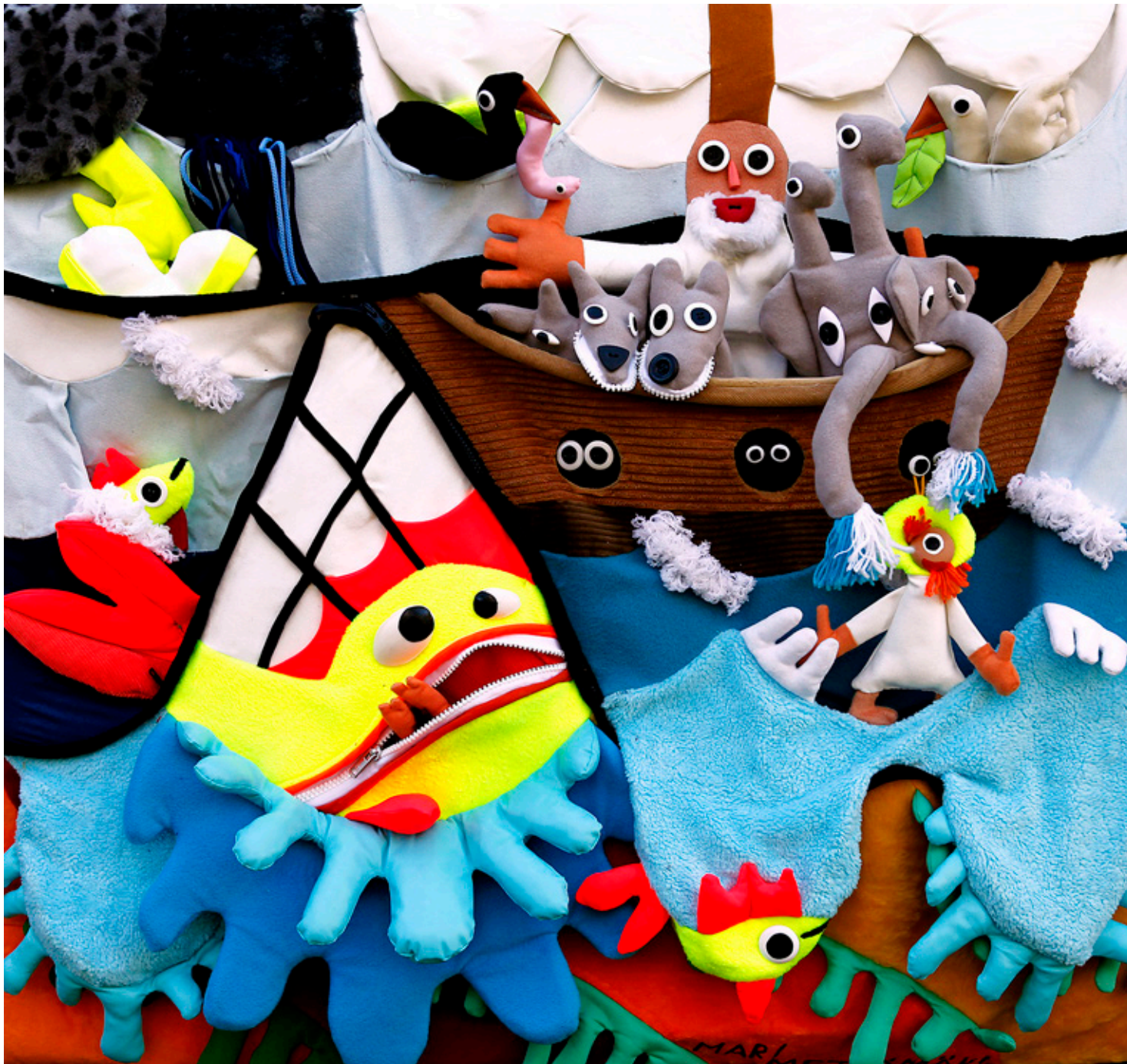
SKAPELSEN, HAVET, jul, påsk och Guds famn är motiven på altartavlorna av Mari Metsämäki.

Utställningen av altartavlorna pågår till den 21 januari i Åbo domkyrka. Tavlorna blir sedan kvar för församlingarna att använda i barnarbetet.