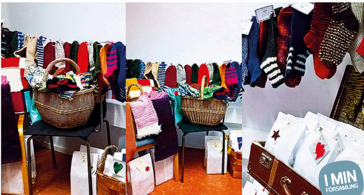
DIAKONIARBETARNAS RUM blev en julklappsverkstad.

Köpes äldre timmerstomat hus i Nedervetil. Tel 0504062003