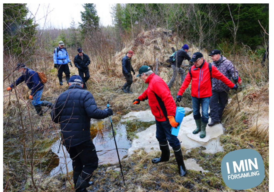
KYRKVÄGSVANDRARNAS ÖVERRASKADES den 19 maj av ett vått parti vid Källbacken i Kvevlax.

la tidens vattenlandskap över flera träsk där kyrk-folket tog sig fram 3,6 ki-lometer över stora vatten, såväl som trånga passager. Fossila åkrar Karakaffegruppen, tillfälligt förstärkt med några markä-gare och hembygdsaktivister, söker sig vetgirigt till de oli-ka platserna med anknytning till kyrkfärderna. Fragment av stigar, som uppehålls av smådjurens notande tassar, kan ännu skönjas och vistan-nar i begrunden över fossila åkrar och anläggningar som inte mera kan förstås. Vi gör paus vid Lövhyd-dan, byggd av markäga-re, för nödvändig korv-grillning med kaffe och på-tår. Det är tid för eftertan-ke. En tidsmaskin vore inte fel för att frammana scener med kyrkfolk gående genom skogen och båtkonvojer som rör över vattnet. Vi får dock nöja oss med vibrationerna från de historiska vingslagen som onekligen känns i krop-pen, visst blev det lokalhis-toriska sammanhanget ännu lite tydligare. Vi gladdes även över en ordentlig dos motion och att endast enstaka älg-flugor syns till. Och visst blir