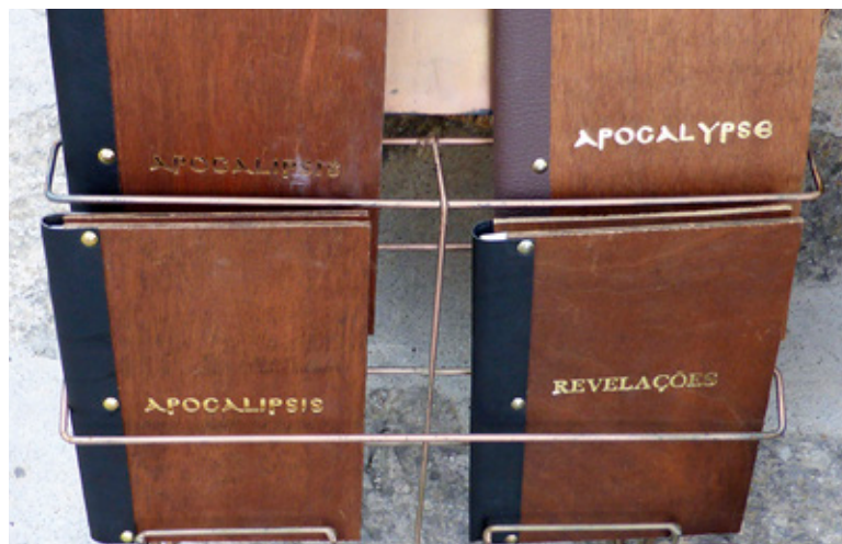
ATT PATMOS är ett populärt resmål för kristna från världens alla hörn märks i utbudet i affärerna vid promenadstråken.

– Motståndarna beskrivs ju ofta som icke-människor, djur, bestar – något som är typiskt för modernt hat-tal. Också allegorin om ”Babyloniska horan” är motbudande.