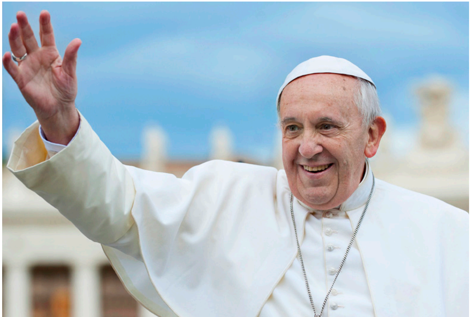
FRANCISKUS HAR varit påve för den katolska kyrkan sedan 2013. Innan det var han ärkebiskop av Buenos Aires i Argentina.

”liberal” i sin kvinnosyn försvarar han dock vissa katolska traditioner. Prästernas celibatvång står han för. Och han är också emot samkönade äktenskap.