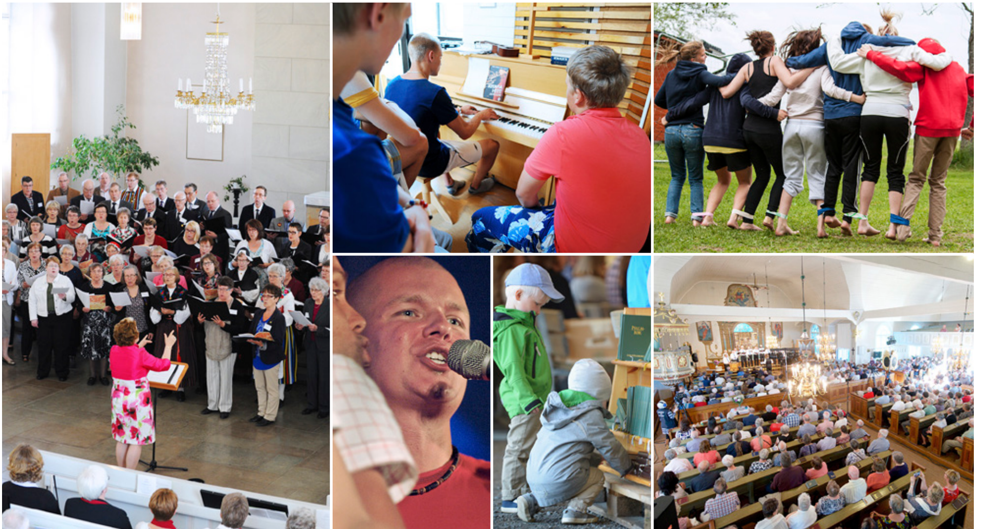
FÖRSAMLINGARNA I Borgå stift får nu ansöka om stöd för utvecklingsprojekt som kan röra allt från ungdomsarbete till diakonin eller gudstjänsten.