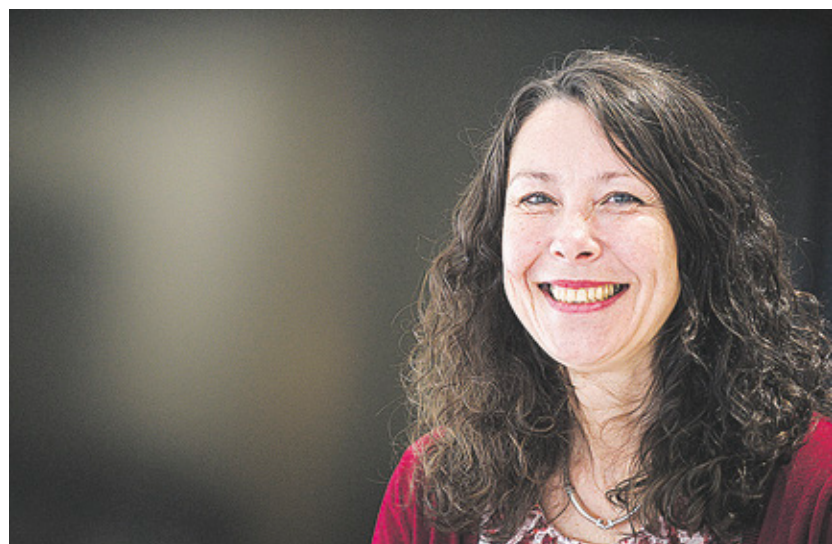
GAMLA HISTORIER intresserar Ann-Sofi Backgren.

Eftersom bägge böckerna handlar om livet i Kvarkens skärgård är de samtidigt världsarvsprodukter.