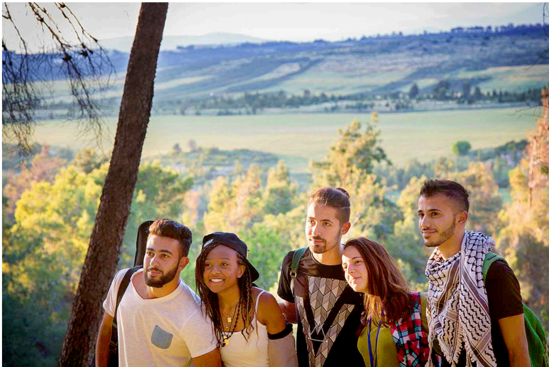
TROTS OLIKA samtalspråk och olika politiska och religiösa åsikter kan en gemensam kör fungera mer än väl.