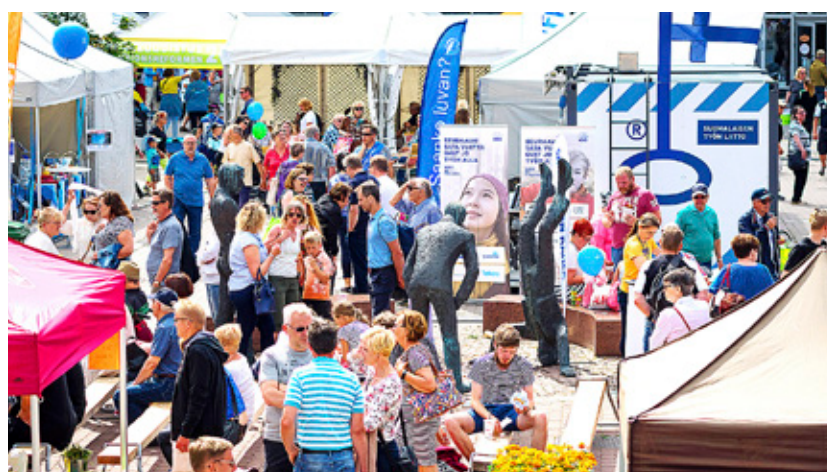
DET VAR många som var på plats i Björneborg för att nå ut med sitt budskap.