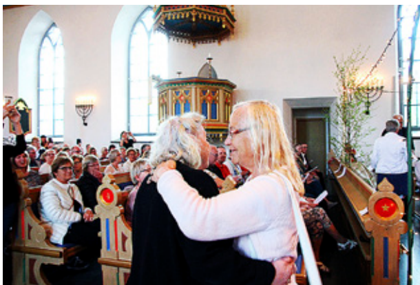
DET VAR inte alla som vågade sig upp på kyrkogolvet.