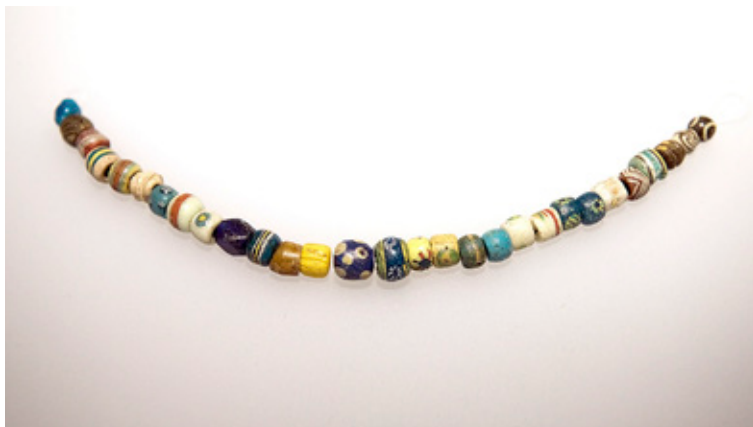
DET HÄR glaspärlhalsbandet hann vara gömt i jorden i 800 år. Det kan ha sitt ursprung från Östersjöns södra kustområden, eller ännu längre från.