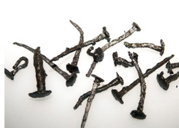
TOTALT HAR 500 järnspikar hittats i samband med ut- grävningarna i Ravattula.

kommit från Tavastland eller från Öst- ersjöområdet.