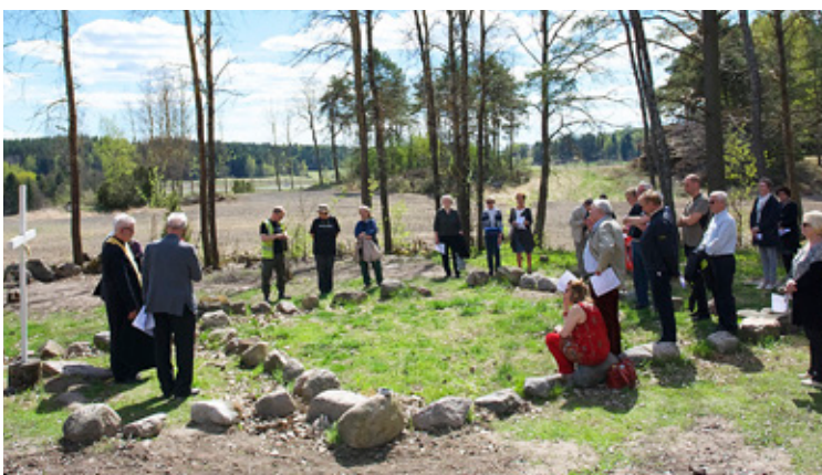
EN EKUMENISK bönestund ordnades för ett par veckor sedan i Ravattula. De utplacerade stenarna visar var den ursprungliga kyrkgrunden finns.