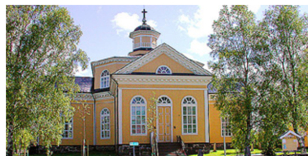
KRONOBY KYRKA.

– Inställningen är att vi har haft en gemensam kommun i Kronoby i 50 år så varför skulle vi inte klara av en gemensam församling.