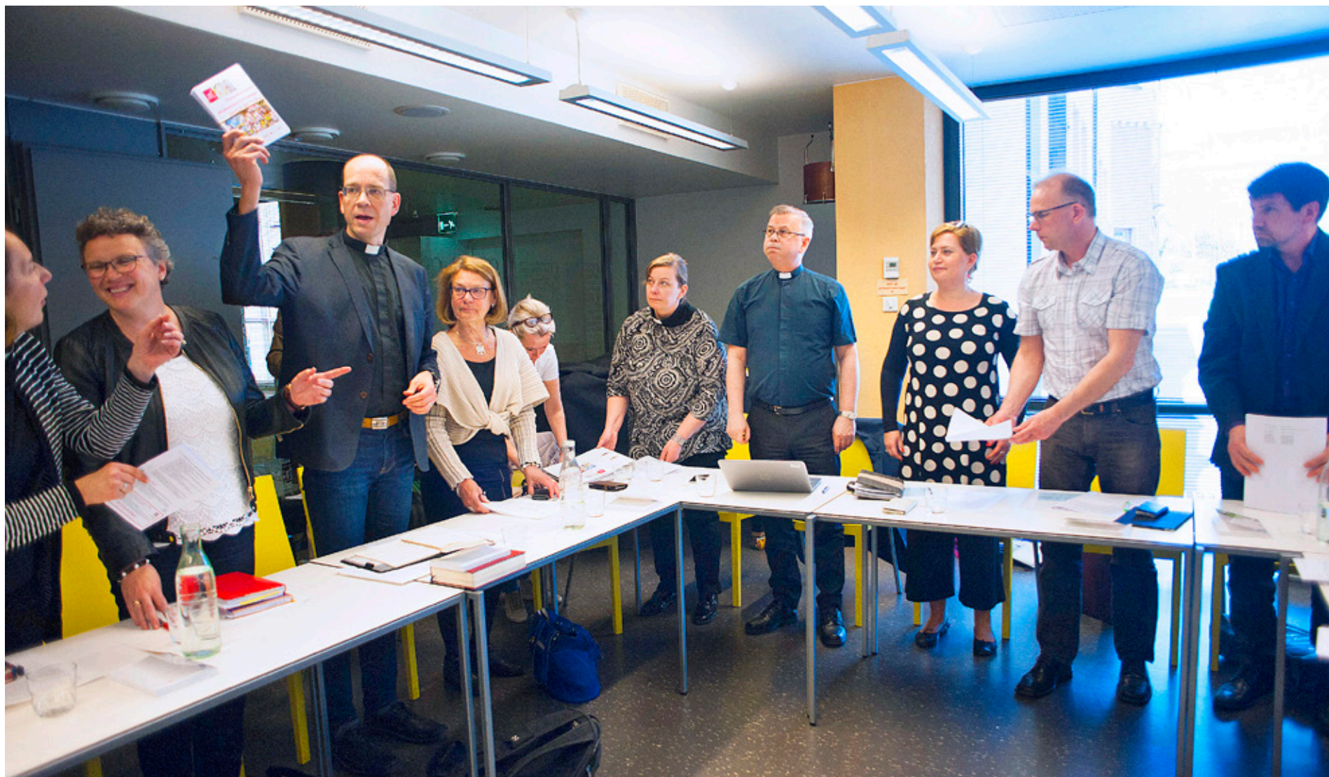
STIFTSFULLMÄKTIGE SAMMANTRÄDE i Aurelia i Åbo förra veckan. Framtiden för organet är oviss efter beslutet att utreda om stiftsfullmäktige ska avvecklas.