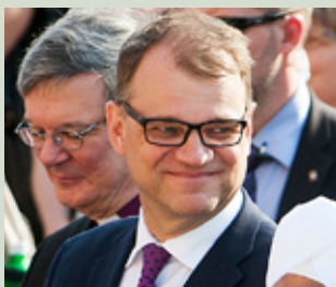
JUHA SIPILÄ.

– Nu vandrar folk längs farliga vägar i Europa utan att veta om de får asyl. Finland strävar efter att hjälpa människor nära deras hem. Från de här områdena kunde vi ta en större andel kvotflyktingar och