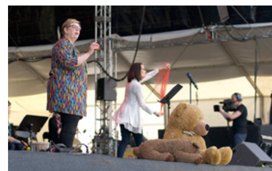
KYRKANS MUSIKFEST bjöd på något för både stora och små.