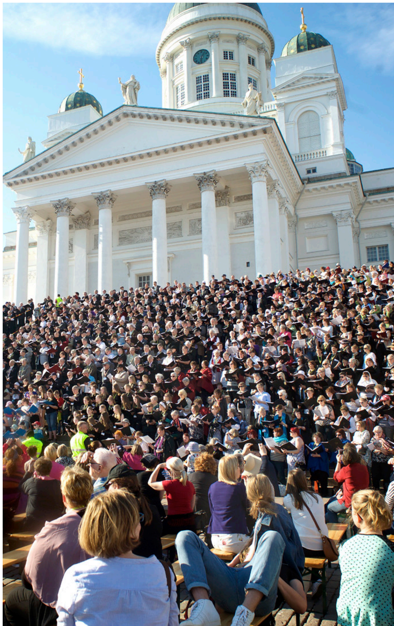
4000 SÅNGARE från hela landet på Domkyrkans trappor, solen förde de med sig.