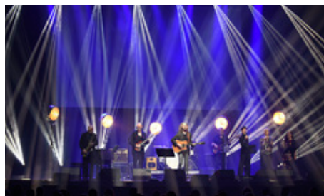
JUKKA LEPPILAMPI , uppbackad av den finländska musikereliten, uppträdde på Logomo.