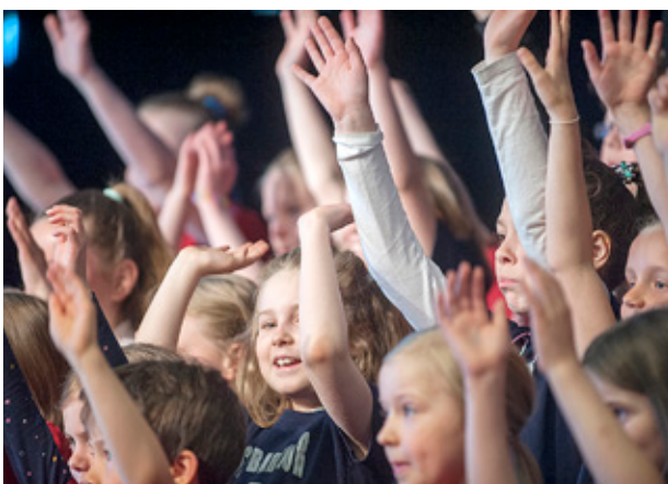
ÅBO SVENSKA församlings barnkör vad både välklingande och pigg på lördagsmorgonen.