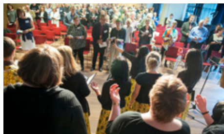
FURAHAKÖREN HÖJDE stämningen under fredagkvällens inledande samling.