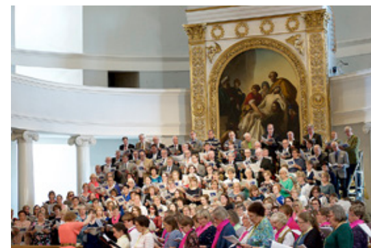
KORISTER FRÅN Finlands svenska kyrkosångsförbund sjöng i Then Nya Pingstmessan.