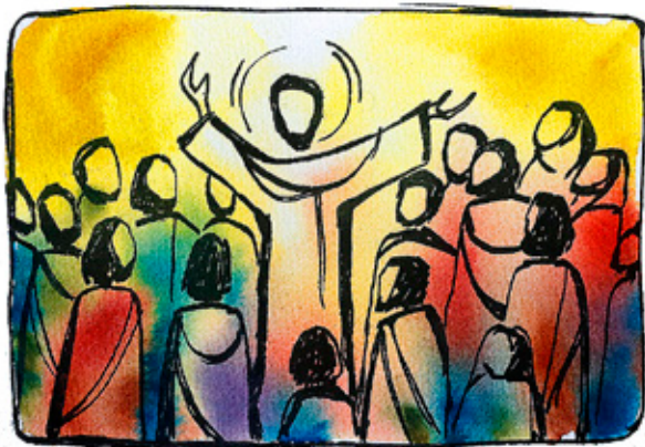
ILLUSTRATION: LINNEA EKSTRAND