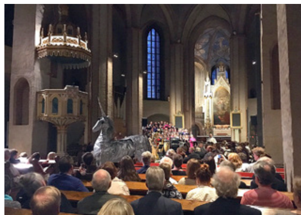
FLORAKÖREN OCH Brahe Djäknar samt en enhörning medverkade i lördagens reformationsmessa.