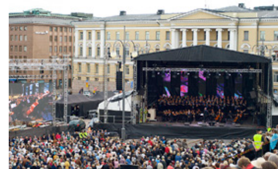
NÄR MESSIASORATORIET uppfördes lockade det storpublik.