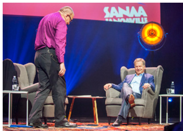
EERO HUOVINENS diskussion med Sauli Niinistö (se text sid 2) var en av kyrkodagarnas mer välbesökta tillställningar.

nåden också ett tillstånd. Om jag begått en avsiktlig synd, måste jag bikta mig för att nå ett tillstånd av nåd, säger Sara Torvalds, aktiv lekman i katolska kyrkan.