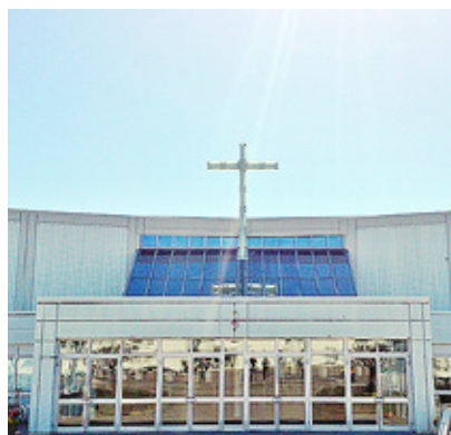
LIVETS ORD i Uppsala.

ras resa. Ser man på Livets Ords historia så har människor kommit och gått. Folk har kommit från olika kyrkor men också gått vidare till dem.