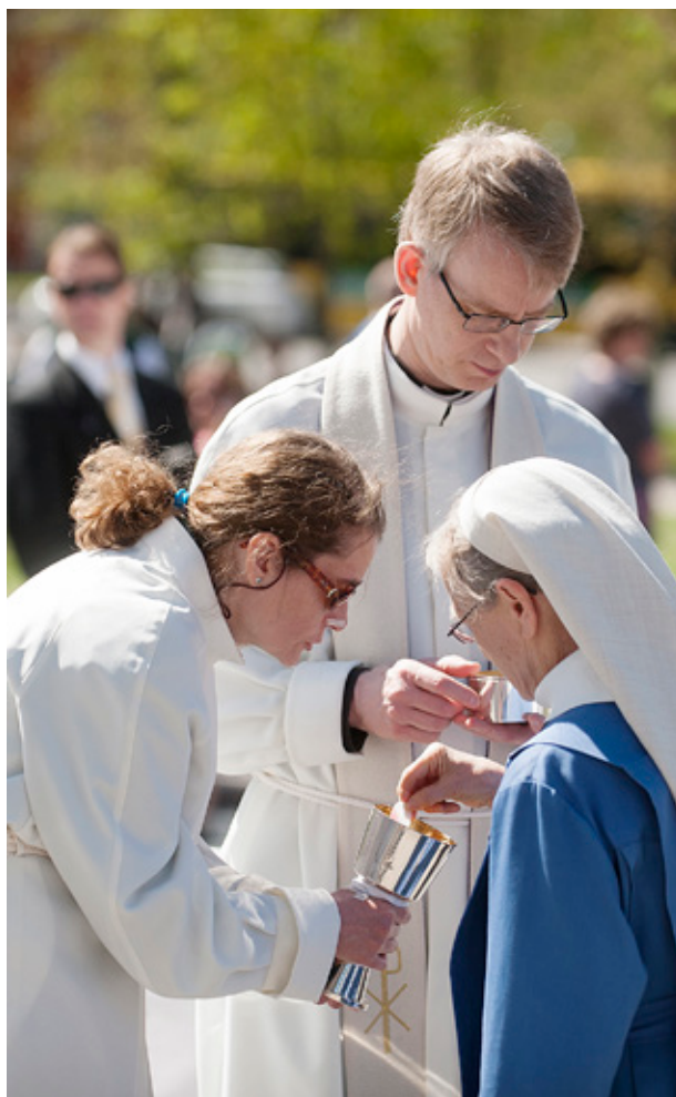
NATTVARD i samband med söndagens gudstjänst som hölls utanför Åbo domkyrka.