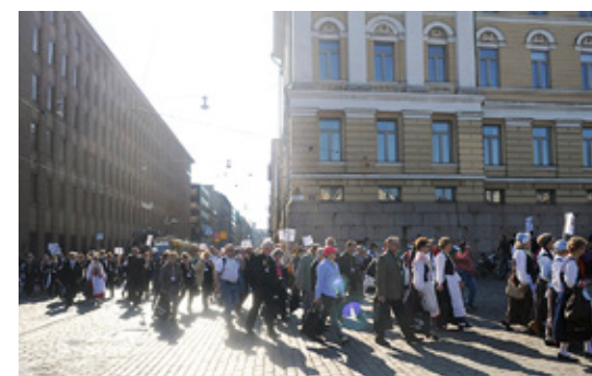
PÅ FREDAGSKVÄLLEN tågade köerna genom staden till öppningsfesten på Senatstorget.