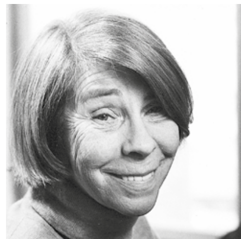
BULEVARDEN SAMLAR mindre kända texter ur Tove Janssons produktion.