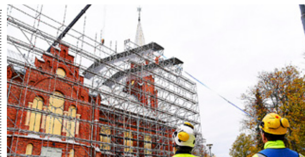
KRISTINESTADS KYRKA.

Kyrkostyrelsen beviljade också sammanlagt 161 000 euro i stöd till kyrkliga organisationer. Stöden ligger på samma nivå som tidigare år, men antalet ansökningar var i år betydligt fler än tidigare. Bland de organisationer som fått understöd finns svenskspråkiga Förbundet Kristin Skolungdom, Förbundet Kyrkans Ungdom, Kran och Retreatstiftelsen.