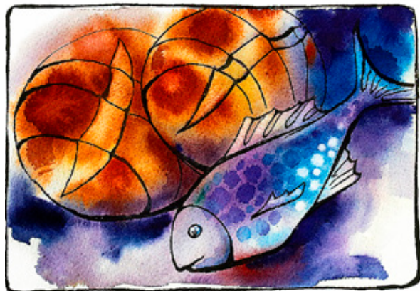
ILLUSTRATION: LINNEA EKSTRAND