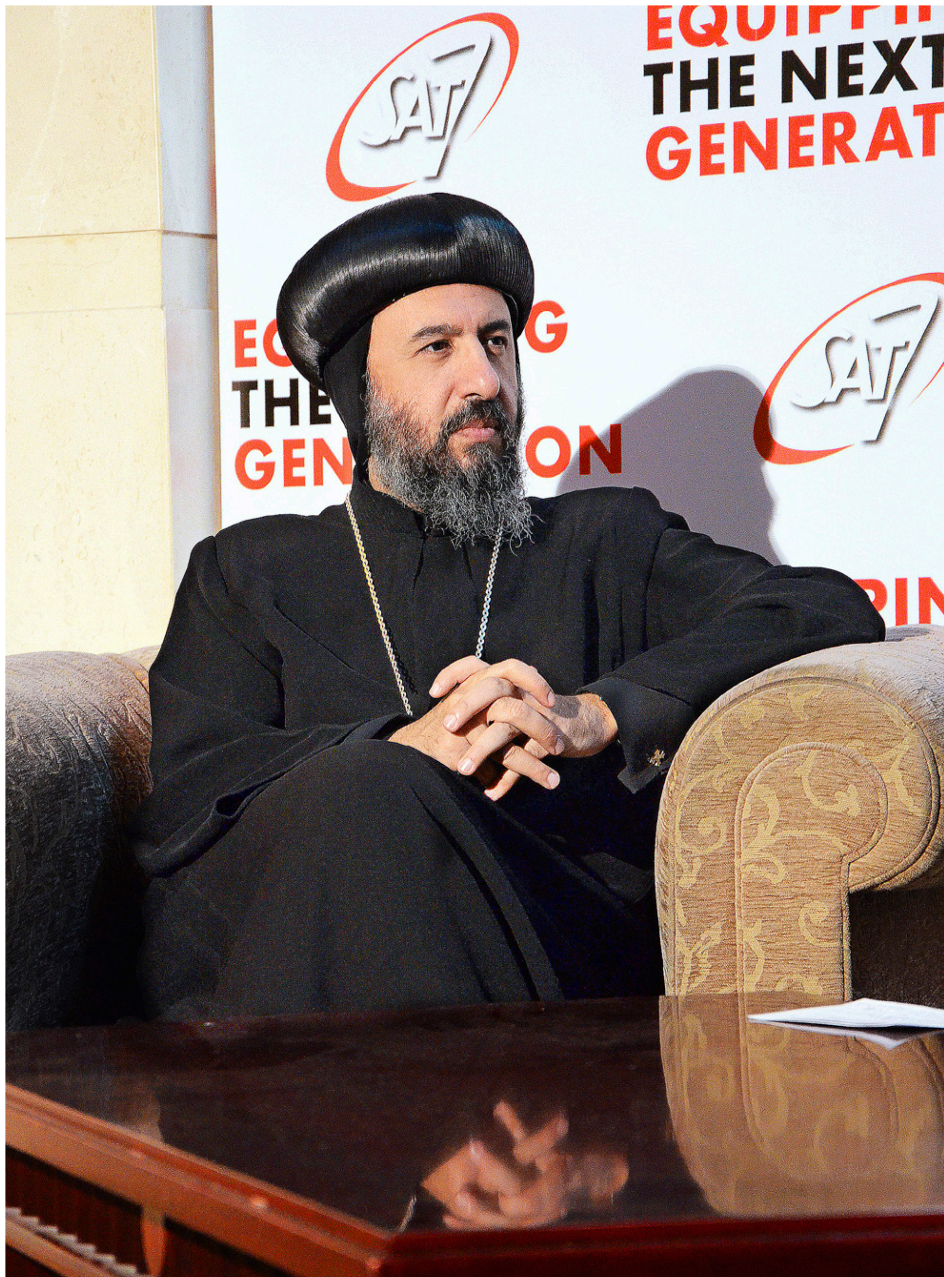
BISKOP ANGAELOS är en högt ansedd ekumenisk aktör från den koptiska kyrkan. Han betecknar det fanatiska våldet som en onska som blivit en gemensam utmaning för hela världen.