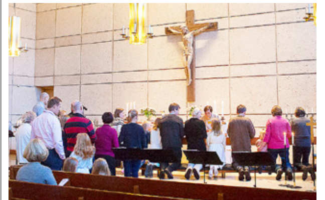
JOHANNES FÖRSAMLING ger inte upp S:t Jacobs kyrka på Drumsö.

– Vi tyckte från båda hållen att det finns vissa evenemang vi kunde samarbeta kring. På Drumsö bor många tvåspråkiga familjer som vi kunde vara bättre på att rikta oss till. Finska kyrkoherden hade redan en massa planer kring sådant den finska församlingen redan gör, och där vi från Johannes kunde komma med. Idéerna var helt okej, men det är viktigt att samarbetet sker redan i planeringsstadiet av varje enskilt evenemang, så att inte vi, som minoritet, faller i skymundan.