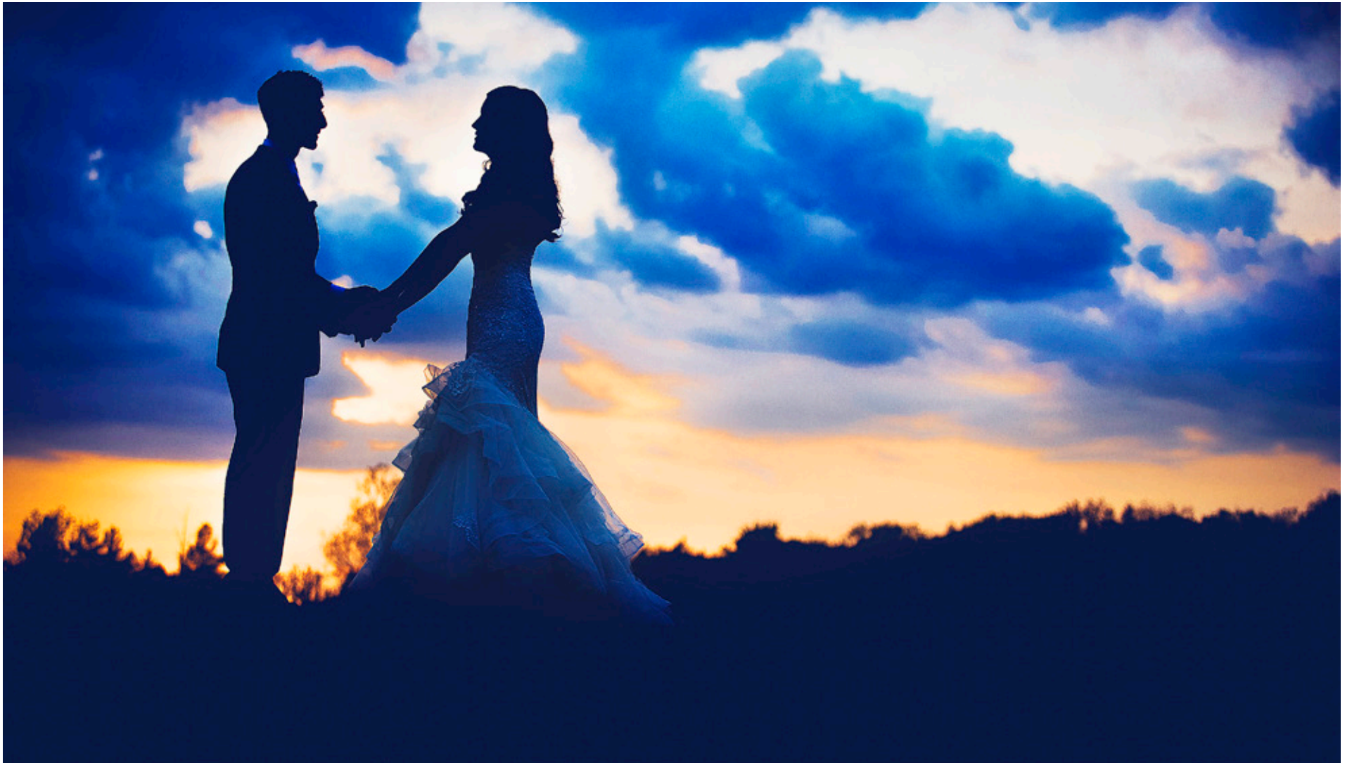
BRÖLLOPSDAGEN ÄR en stor och viktig fest. Att välja musik till vigseln kan vara svårt, för alternativen är många.