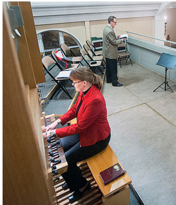
LISEN BORGMASTARS kan spela på upp till fyra vigslar en sommarlördag.

Inspelad musik kan vara okej i en del församlingar, men i Jakobstads församling föredrar kantorerna levande musik.