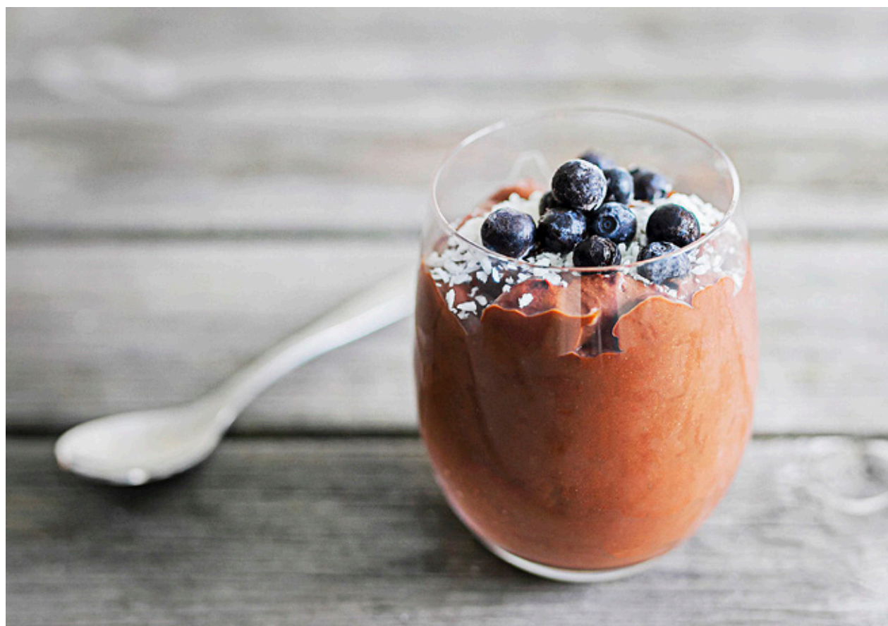
CHOKLADMousse gjord på avokado kan vara riktigt gott.