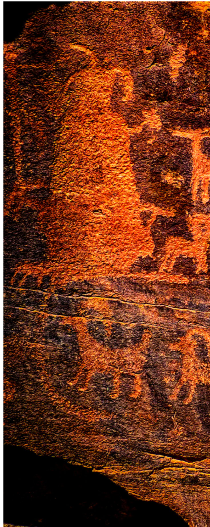
ENLIGT WRIGHT uppstod gudarna i jägar-samlar-samhällena som en sorts förlängning av naturens krafter.

I den här fasen av civilisationernas utveckling kommer vi till ett skede ur vilket Wright hämtat en av bokens huvudpoänger och budskap. När ett folk i krig vann över ett grannland så övertog man också det erövrade landets panteon, det vill säga gudasamlingen, och införlivade den med den egna gudavärlden. Trots att man hade vunnit över sin rival så visade man ofta respekt för fiendens gudar och gav dem mer eller mindre upphöjda positioner i de egna gudarnas hierarki. Ibland sammansmälte man två olika gudar