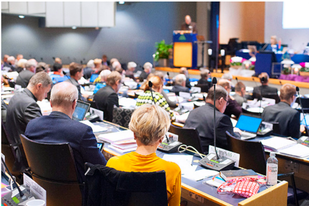
ETT INITIATIV om att samkönade par ska kunna vigas i kyrkan behandlas i kyrkomötet i maj. Bilden är tagen på kyrkomötet i november 2016.