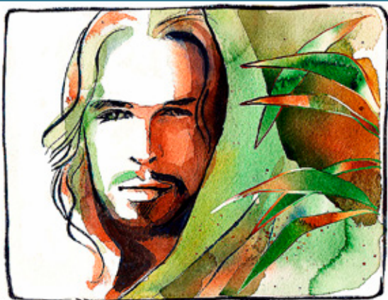
ILLUSTRATION: LINNEA EKSTRAND