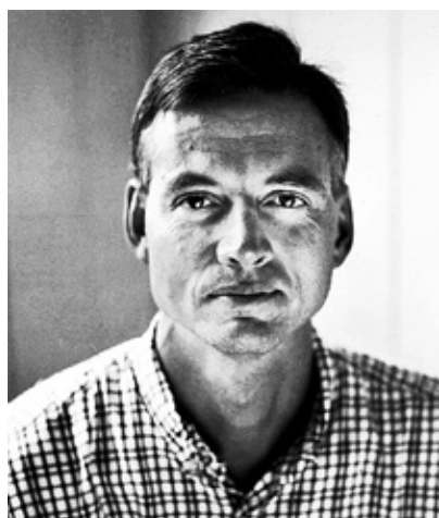
ROBERT WRIGHT beskriver religionernas uppkomst ur ett evolutionspsykologiskt perspektiv.

men var inte heller först med monoteism, utan Egypten, och det spekuleras i om den judiska monoteismen kan ha fått influenser därifrån.