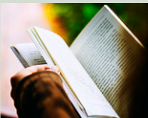
UNDER FASTAN får livet bli lite enklare och långsammare.

Att fasta behöver inte betyda att du skär ner på ditt matintag. Fastan kan