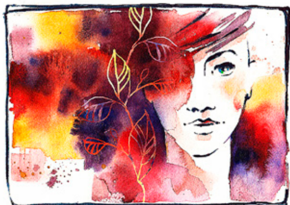
ILLUSTRATION: LINNEA EKSTRAND