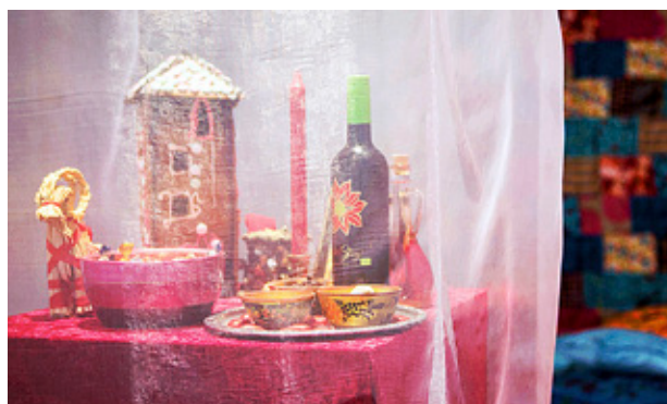
DET KRISTNA festbordet presenterar julen.

– Här har vi tänkt att barnen får titta på festborden och stanna för ett som intresserar dem, och så får de höra mer om just den festen, till exempel i form av en saga. Vi har en festsagobok i sagohörnan att läsa ur. När det gäller de judiska purim-festen berättar vi om den modiga drottning Ester, vars berättelse finns i Esters bok i Gamla testamentet.