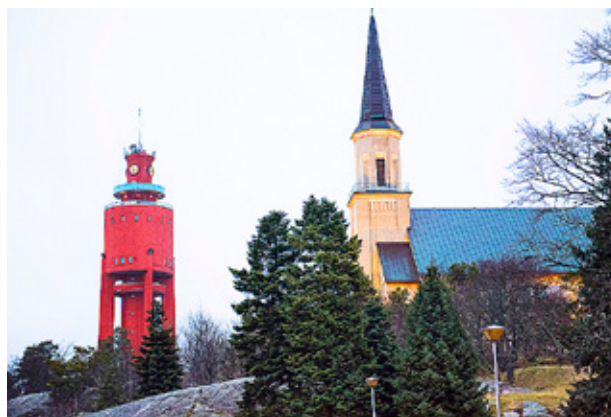
KYRKAN I Hangö fyller 125 år i år.