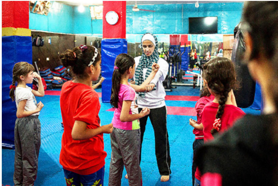
KARATE HÖR till de mest populära aktiviteterna som genomförs för barn och unga med medel från insamlingen. Alla får delta – både jordaniska unga och flyktingar.

Människohandel och med den jämförbart utnyttjande anses vara en av de största utmaningarna idag då det gäller