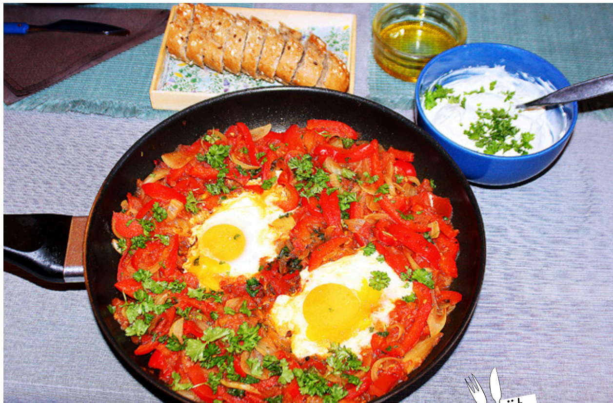
I VECKANS recept kombineras olika smaker på ett lyckat sätt.