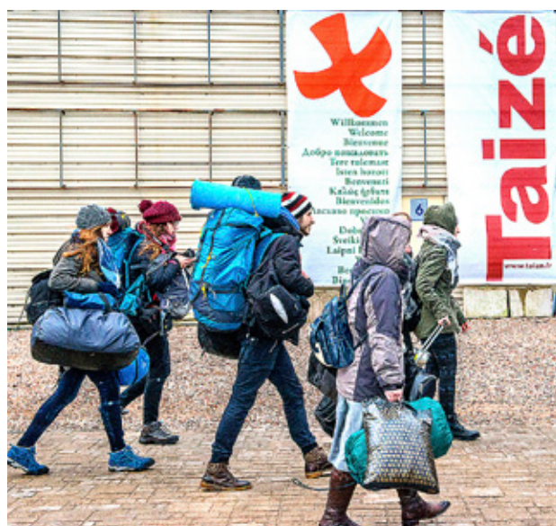
DELTAGARNA ANLÄNDER med buss, båt och flyg från hela Europa och från övriga världsdelar.