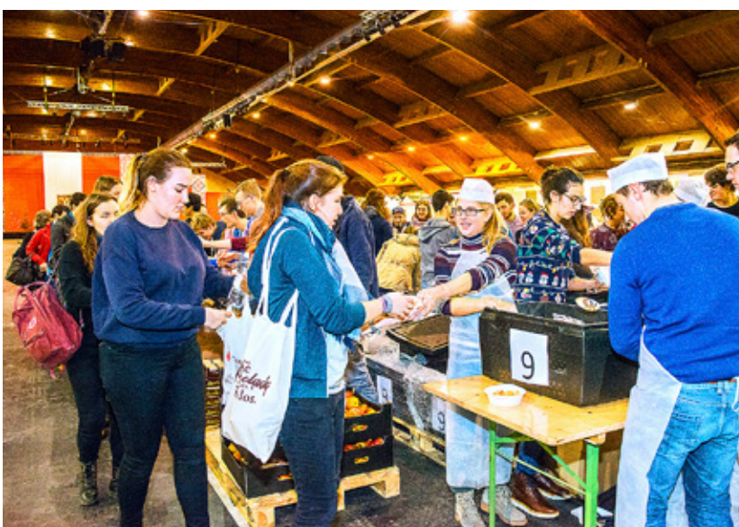
VARJE KVÄLL delas varm middag och lunchmatsäck för nästa dag ut i en av hallarna på mässområdet.