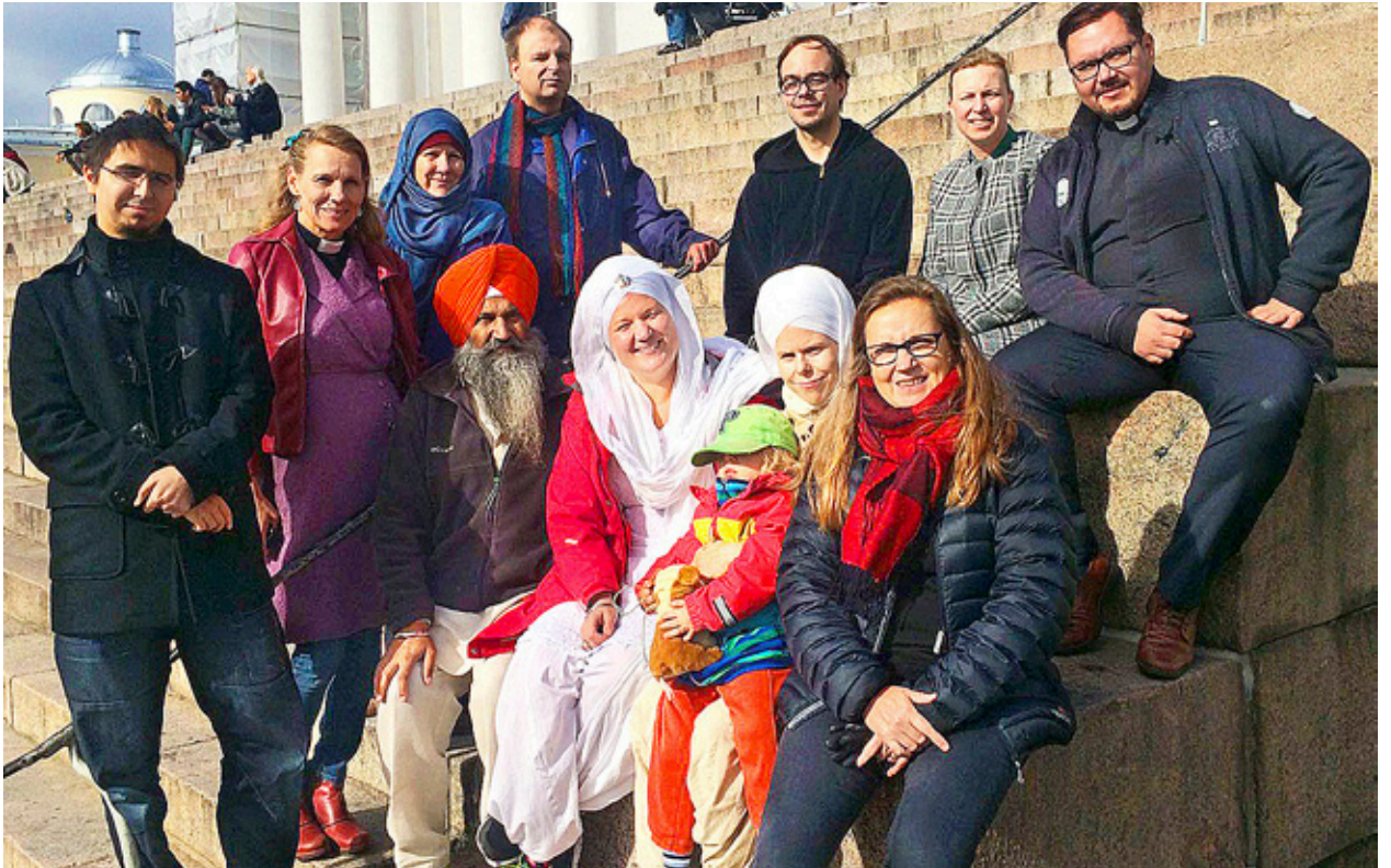
RELIGIONSIALOG kan se ut på många sätt. I höstas marscherade representanter för olika trossamfund tillsammans för den gyllene regeln i demonstrationen "Peli poikki" i Helsingfors.

Liten tvåa (43,5 m 2 ) med bastu och inglasad balkong uthyres åt skötisam, djur- och rökfri hyresgäst. Bostaden finns i centrum av Vasa, nära sv. Hanken. Ledig 1.3. Tel. 050-3652901/kvällar