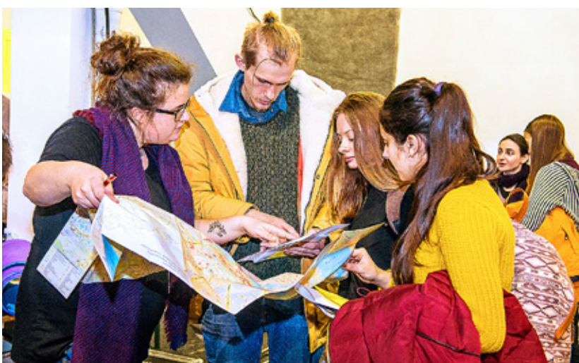
TRE VECKOR före mötet kunde alla deltagare fördelas i värdfamiljer i och runt Riga. Kartor används flitigt!