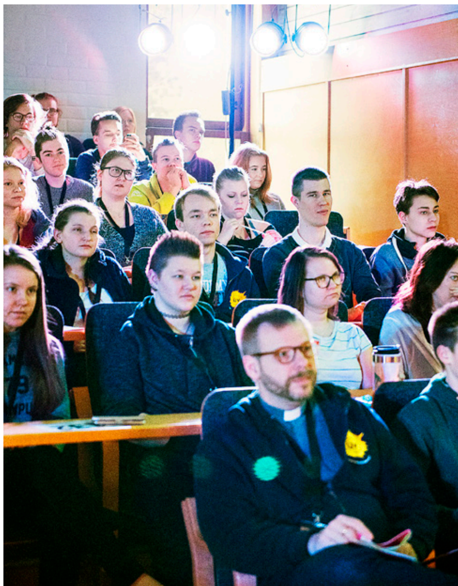
MÅNGA TIMMAR i plenisalen och många svåra frågor. Ombuden som deltog i den 49:e upplagan av Ungdomens kyrkodagar tog sina förtroendeuppdrag på allvar.

– En del församlingar använder hemsidor, andra använder Facebook – idén är