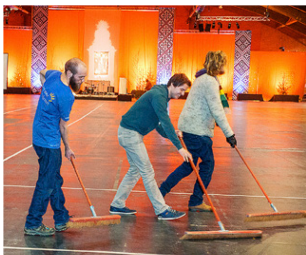
ETT STORT antal deltagare anmäler sig till olika arbetsgrupper och skötte det praktiska under dagarna.