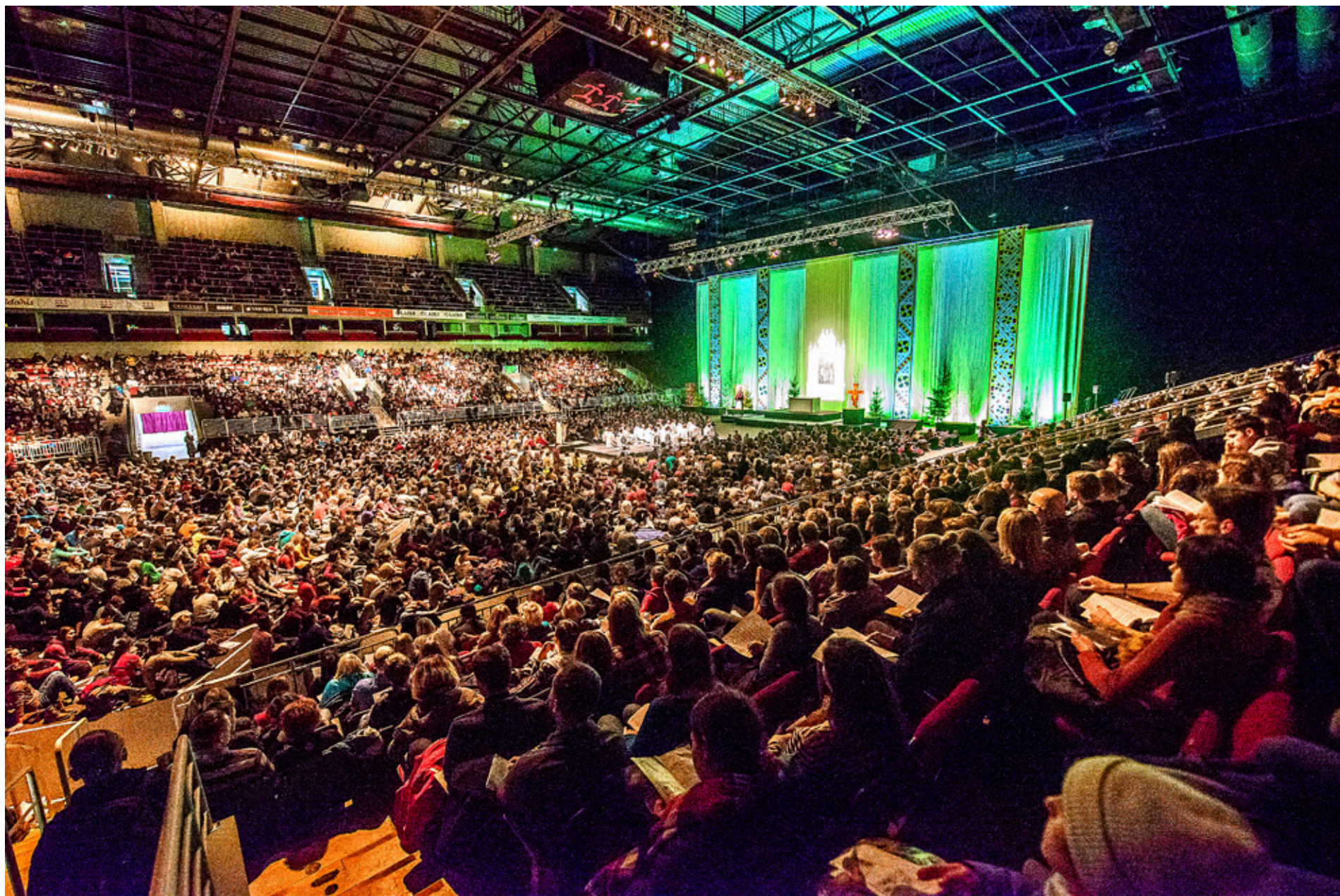
RIGAS STORA sportarena förvandlas till böneplats under Europamötet.