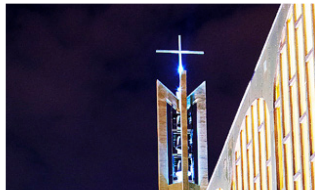
VI TALAR ofta om den lutherska kyrkan, men Luther ville inte att kyrkan skulle få hans namn.

SVÄRT ÄR att frångå gamla vanor. Så måste man väl förstå att de lutherska kyrkorna i Norden betecknar sig som evangelisk-lutherska trots att det under några sekler inte fanns verkliga alternativ. Det ska förstås så att det evangeliska är det primära och viktigaste.