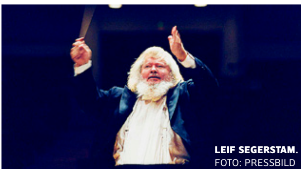
LEIF SEGERSTAM. FOTO: PRESSBILD

Säsongen öppnas i januari med Beethovens 9:e symfoni. Verket dirigeras av chefsdirigent Leif Segerstam . Till serien hör också avgiftsfria föreläsningar som hålls på infotorget vid Åbo huvudbibliotek under tisdagar varje kon-