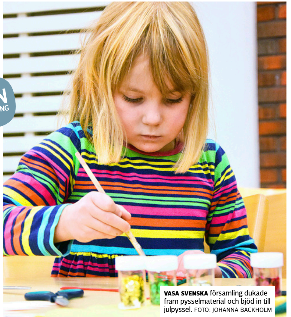
VASA SVENSKA församling dukade fram pysselmateriell och bjöd in till julpyssel.