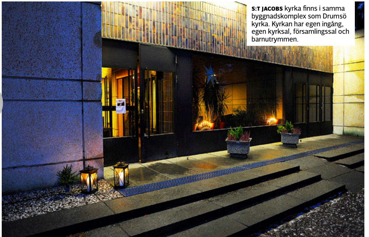
S:T JACOBS kyrka finns i samma byggnadskomplex som Drumsö kyrka. Kyrkan har egen ingång, egen kyrksal, församlingssal och barnutrymmen.

2. Jag är personligen absolut för ett samarbete över språkgränserna i allmänhet och på Drumsö i synnerhet, eftersom inställningen till språkundervisning och svenska är positiv på Drumsö. Församlingen borde hålla fast vid och utveckla verksamheten till att möta det behov som finns på Drumsö i dag