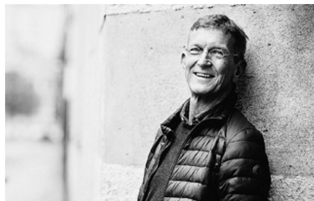
TOMAS SJÖDINS nya bok är, kanske lite överraskande, en strålande bok om ledarskap.