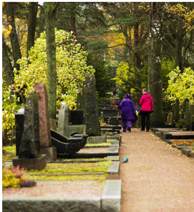
ANTALET ICKE-MEDLEMMAR som begravts på församlingarnas kyrkogårdar har på femton år ökat med 37 procent.