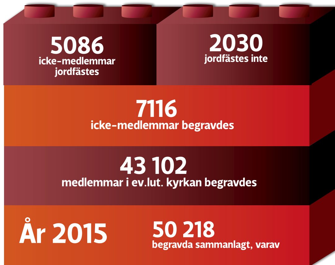
I KLOSSARNA syns antalet begravda på församlingarnas kyrkogårdar 2000–2015.

Intill en del begravningsplatser finns ett konfessionslöst område för personer som inte vill få sin sista vila på en kristen kyrkogård. Om en kristen jordfästning inte kommer på fråga kan anhöriga ändå få använda sig av församlingens lokaler, som till exempel begravningskapell, för konfessionslösa begravningsceremonier. I till exempel Helsingfors hyr samfälligheten ut begravningskapellet till anhöriga till avlidna personer som inte varit medlemmar i kyrkan, men praxisen varierar på olika orter i landet.