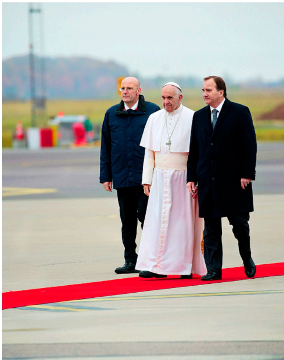
PÅVEN FRANCISKUS välkomnades av Sveriges statsminister Stefan Löfven.

Läs mer om inledningen av reformationåret i Malmö i nästa KP.