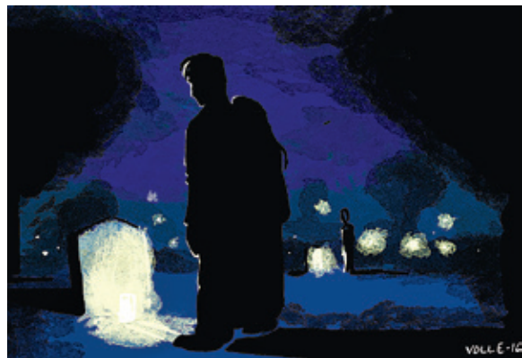
ILLUSTRATION: KARSTEIN VOLLE