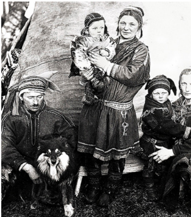
EN SAMISK familj i traditionell klädsel. Fotografiet är taget i Finland år 1936.