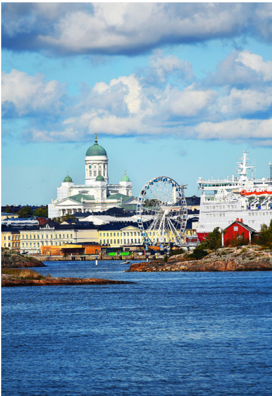
LUTHERPLUS-EVENEMANGET i oktober är det första i sitt slag i Helsingfors. På våren ordnar Helsingfors församlingarna kanske ett liknande evenemang, men med en lite annorlunda profil.

– Mindre projekt kan få max 10 000 euro. Handlar det om större satsningar blir det också fråga om mer rigo-