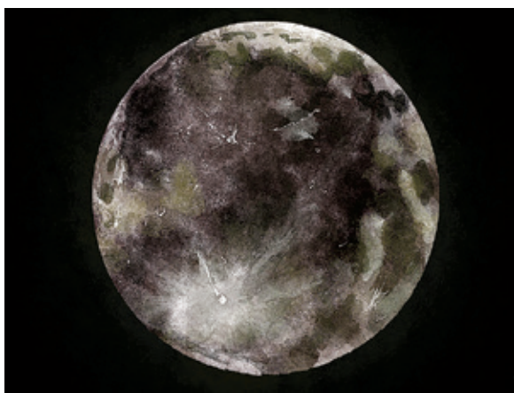
ILLUSTRATION: KARSTEIN VOLLE