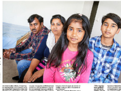
FÖRRA VECKAN berättade Kyrkpressen om familjen som utvisades från Finland trots att pappan i familjen sannolikt har en väntande dödsdom i Pakistan.

PKK-REKOR. I de berömda PKK-utvisningarna har ett av de utvisade familjerna varit en som utvisades från Finland trots att pappan i familjen sannolikt har en väntande dödsdom i Pakistan.