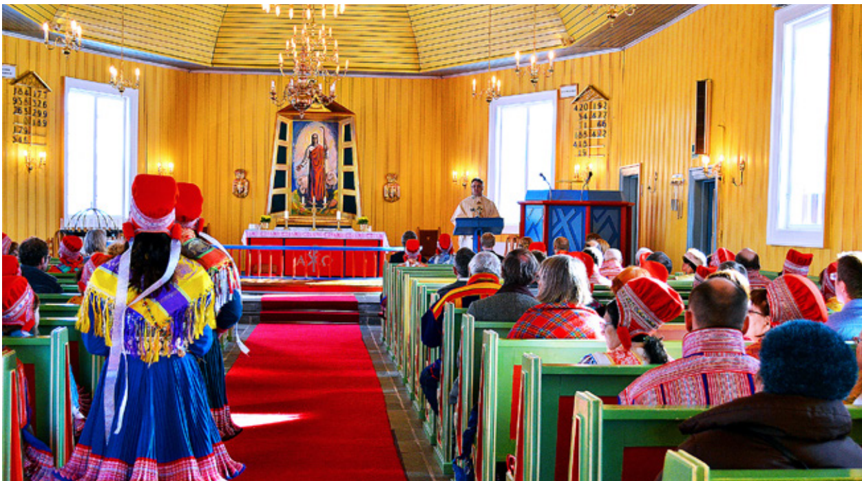
KYRKAN I Kautokeino är en populär samlingsplats. Över 85 procent av befolkningen här har samiska som modersmål.