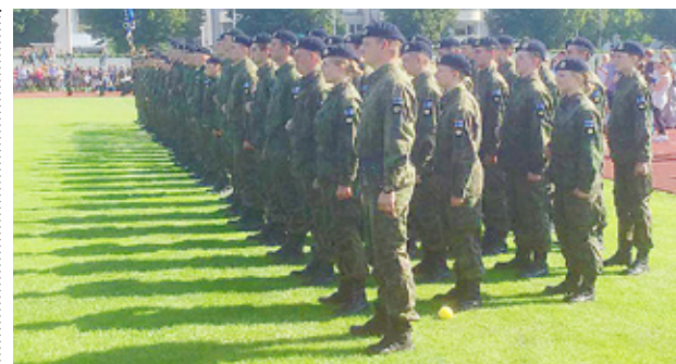
NYTT ANSVAR. Efter en dryg månads tjänstgöring och avgivet löfte är rekryterna från Dragsvik nu jägare.