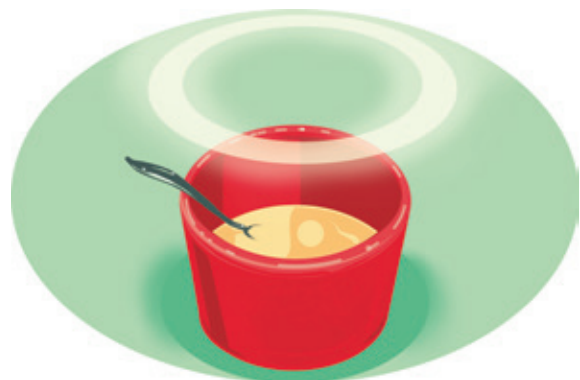
ILLUSTRATION: KARSTEIN VOLLE