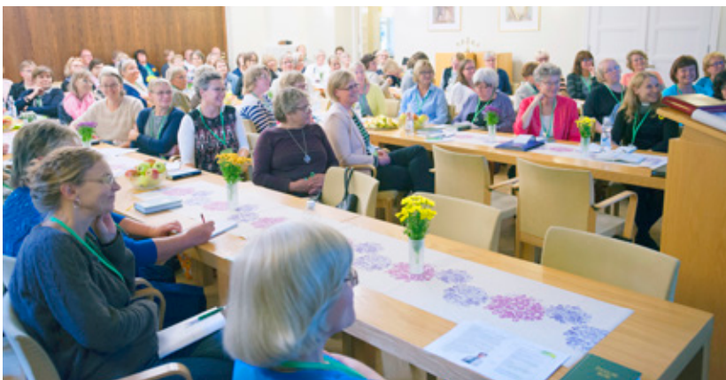
DIAKONIAR BETARNA I Svenskfinland samlades till diskussion kring sitt arbete i mitten av augusti.

CABLE-METODEN STÅR FÖR COMMUNITY ACTION BASED LEARNING BY EMPOWERMENT. HELSINGFORSFÖRSAMLINGARNAS PROJEKT ”DÄR NÖDEN ÄR STÖRST – DIAKONI PÅ SVENSKA” BASERAR SIG BLAND ANNAT PÅ CABLE-METODEN.