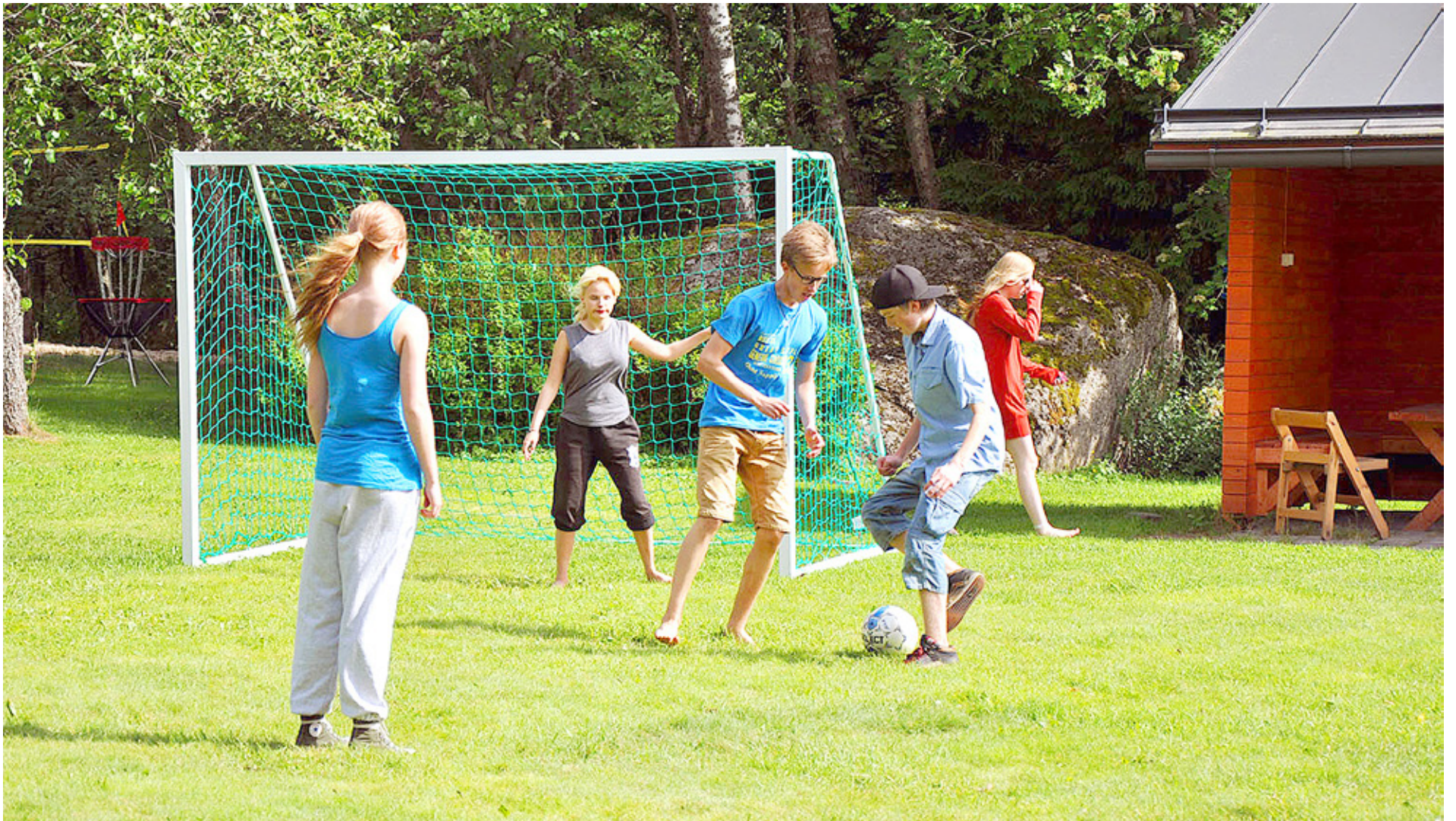
DE SENASTE knappa tjugo åren har ungdomarna i Vasa svenska församling fått vänta ett år längre på konfirmationen än sina jämnåriga i andra församlingar. Äldre konfirmander har gett konfirmandarbetet en annan dynamik, men på bekostnad av kontinuiteten i ungdomsarbetet.