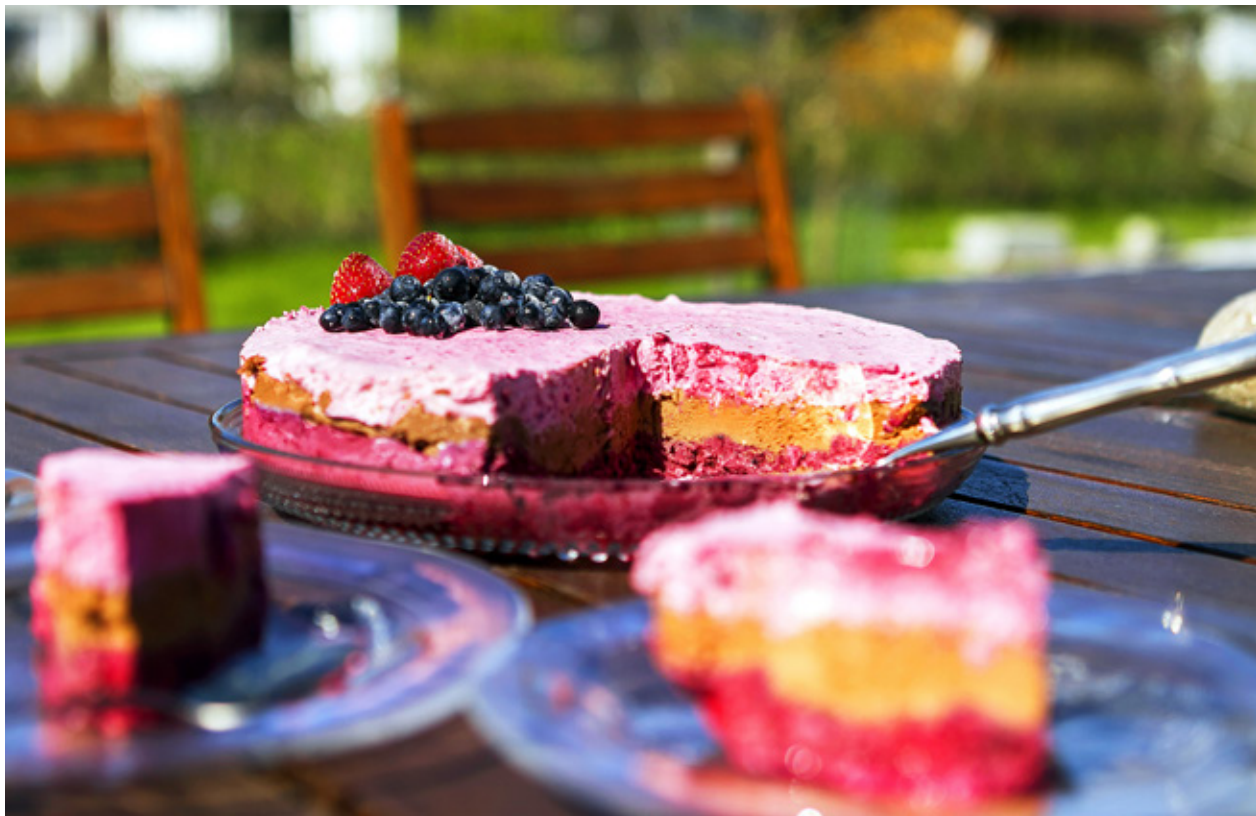
CHEESECAKE MED bär och choklad är en riktig sommarfavorit – kanske något att bjuda kollegerna på när de återvänder till jobbet efter semestern?