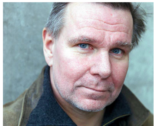
"TERMINAL" ÄR en brännande aktuell roman, skriver Kyrkpressens recensent.