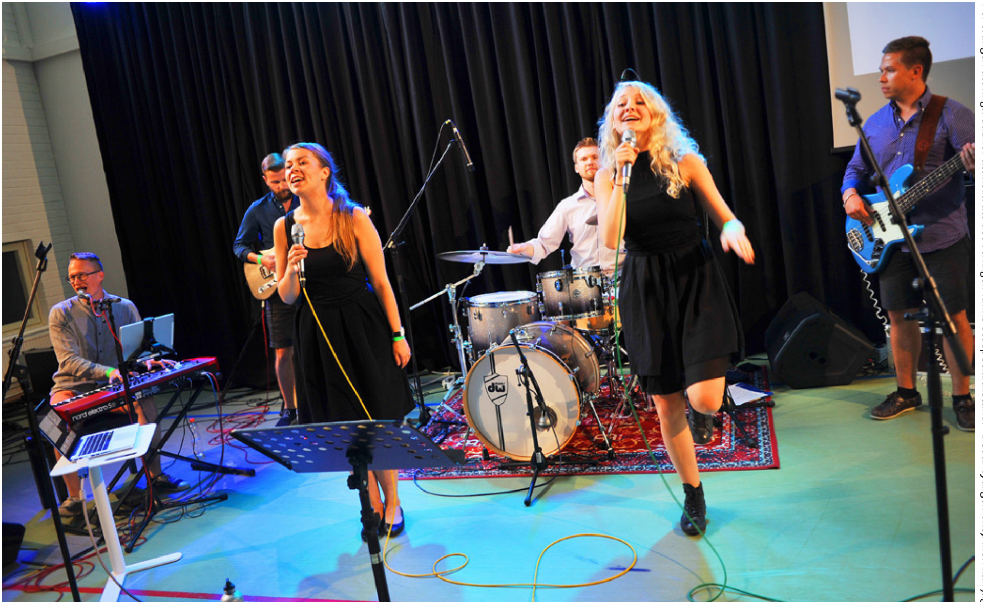
REVIVE GOSPEL vill göra gospel på ett annorlunda sätt. Nu drömmer de om fler egna låtar – och kanske en skiva.