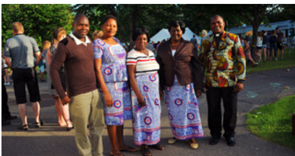
GÄSTERNA FRÅN Malawi trivdes i vimlet under KU:s familje- läger i Pieksämäki.

Hjälp, vilket program! Hur orkar ni? undrar KP:s re- daktör och får hövliga le- enden till svar från Malawi- gästerna.