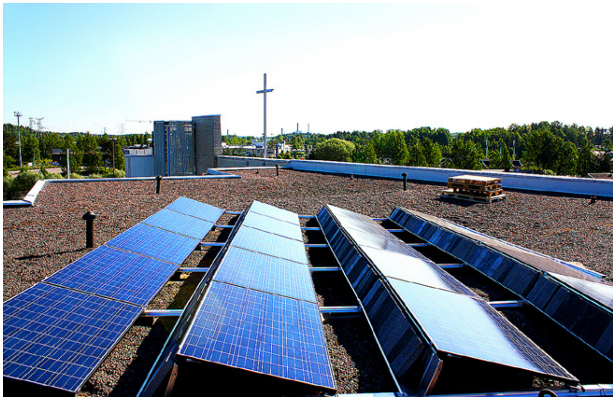
TAVASTBY KYRKA i Vanda är den första kyrkan i Finland att producera energi med hjälp av egna solpaneler.