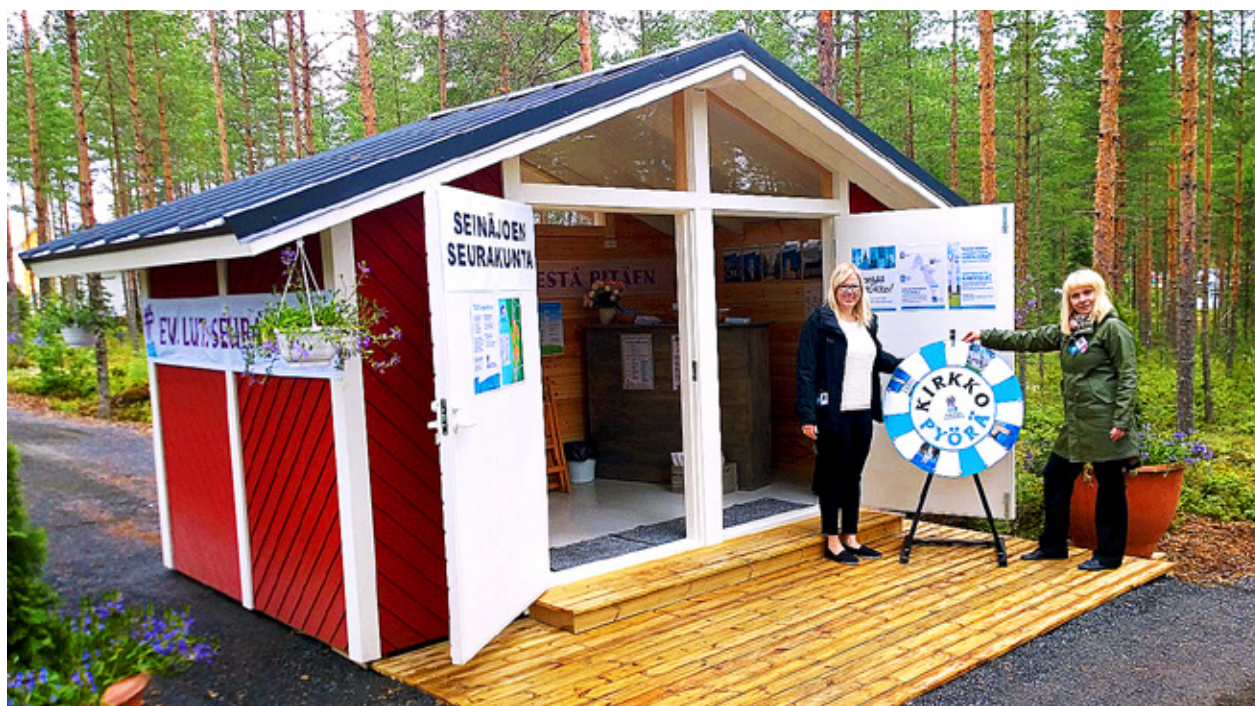
PÅ BAKGÅRDEN till utställningshus nr 32 finns kyrkans egen stuga med bland annat en helt egen version av lyckohjulet.

2 stora rum + vard.r o kök lämpligt för 2 kimpab. stud. flickor, tex Arcada el Practicum osv. hyra 480e/pers/mån inkl el o vatten ledig tel 040-5182867