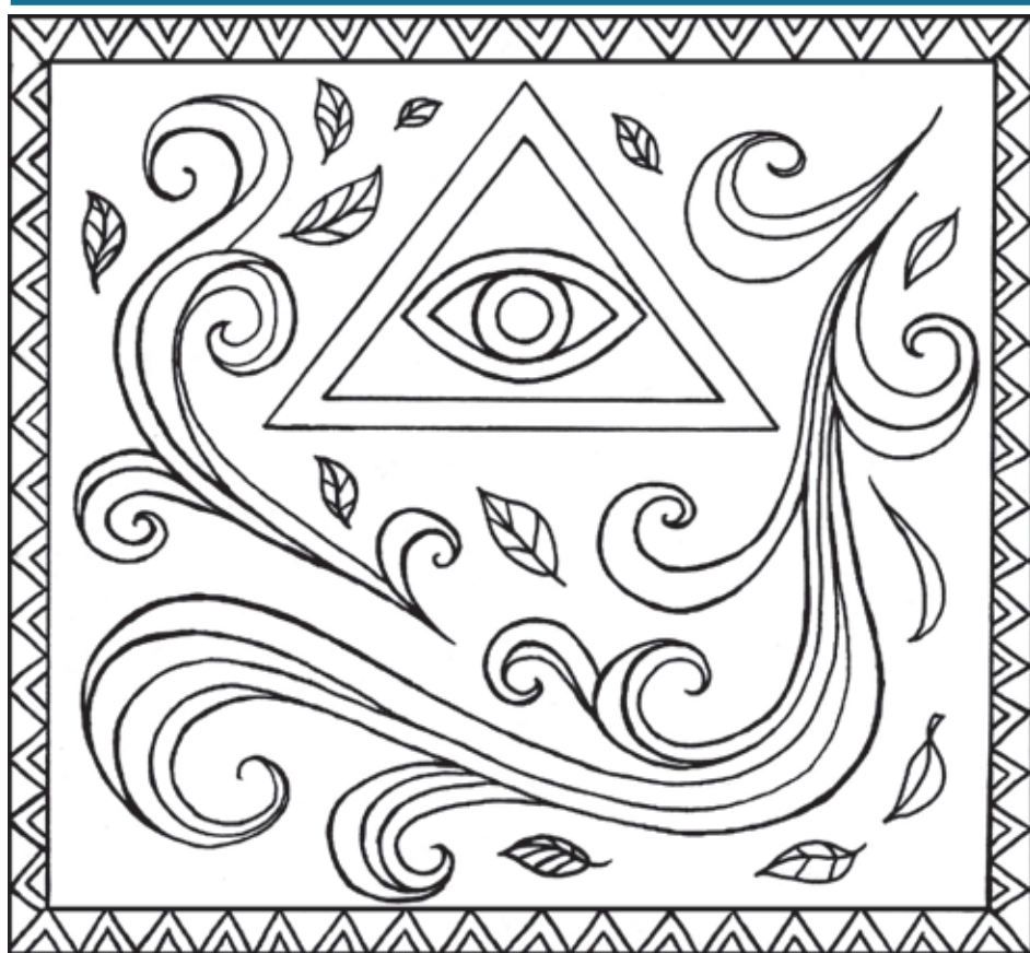
ILLUSTRATION: JULIA LINDÉN