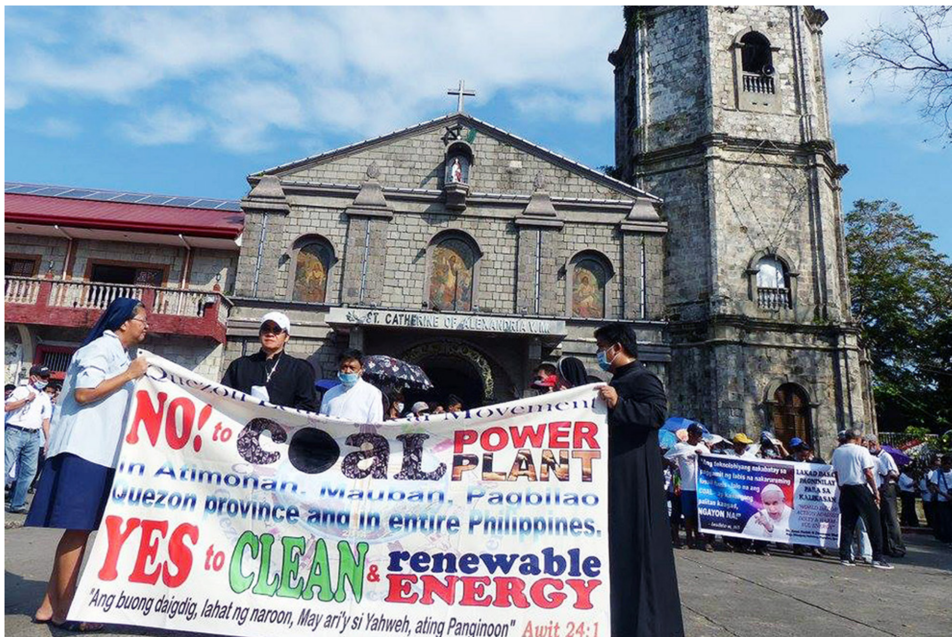
PÅ FILIPPINERNA tvekar inte den katolska kyrkan att gå i första ledet när folket demonstrerar för miljön.