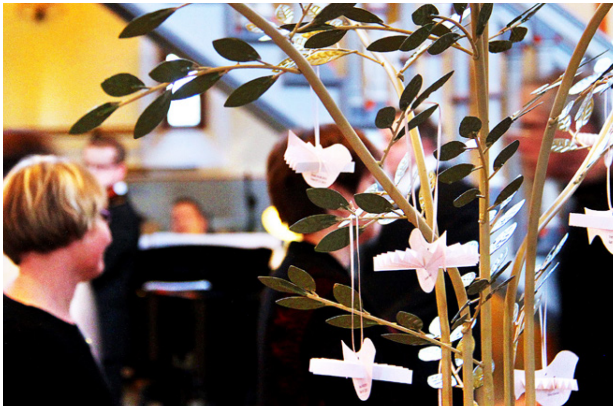
DOPTRÄDET I Sibbo kyrka fylls med fåglar vartefter nya barn döps in i församlingen.

– Ända sedan jag såg ett dopträde i en svensk kyrka har jag tyckt om tanken.