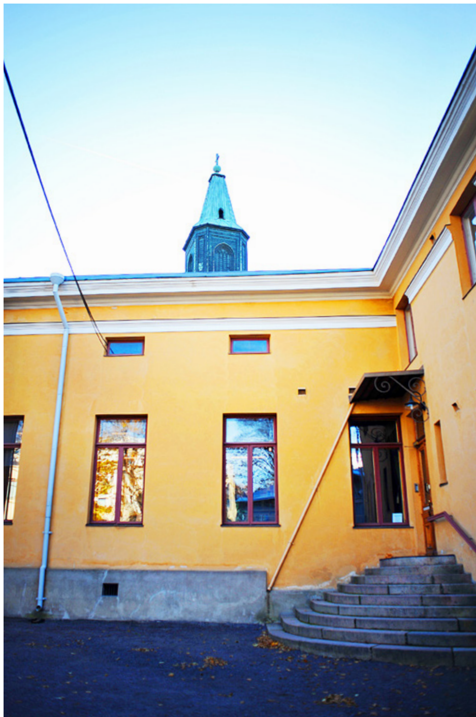
ÅBO AKADEMI har för tillfället 1300 anställda varav 660 arbetar med undervisning och forskning. Årligen utexamineras 540 magistrar och 75 doktorer. Källa: abo.fi.

– Nedskärningarna påverkar inte de studerande