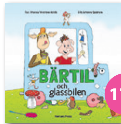
Bärtil och glassbilen