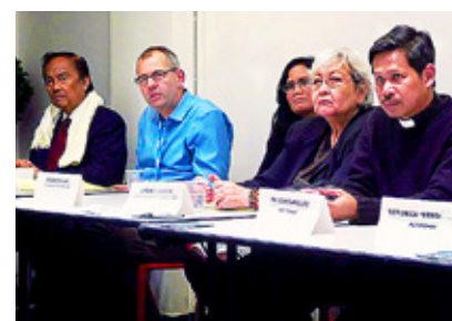
FADER EDU ser sig som andlig ledare och aktivist.

– Som biskopssynoden träffande förklarar: ”Handlingar till förmån för rättvisa och omvandling av världen är