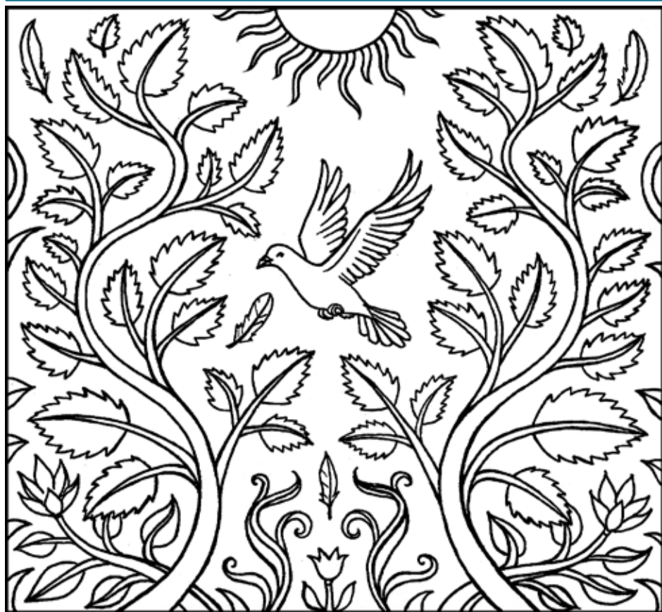
ILLUSTRATION: JULIA LINDÉN