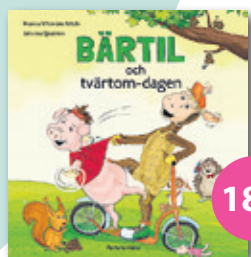
Bärtil och tvärtom-dagen