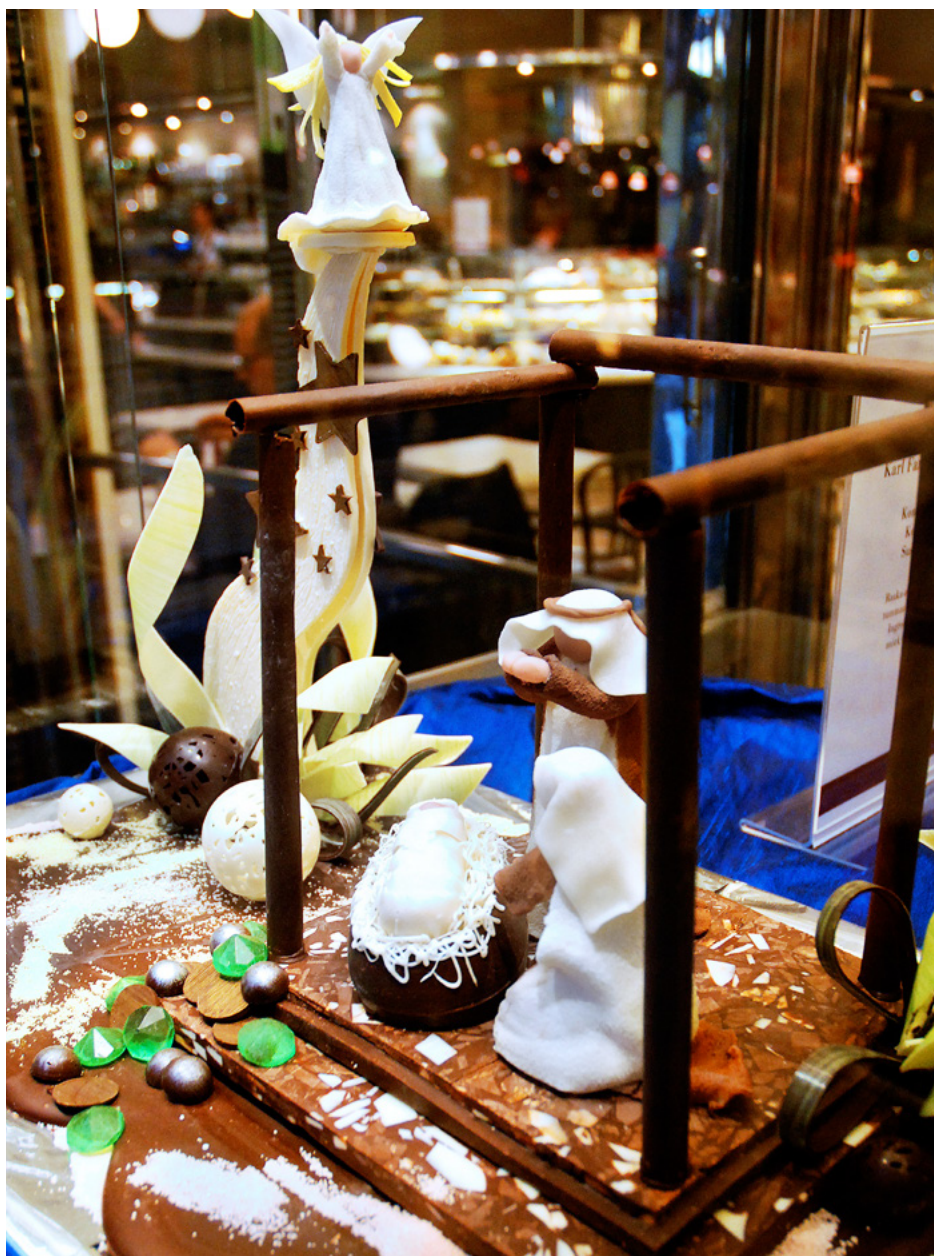
EN KRUBBA gjord av choklad väntar i skyltfönstret på en sötsugen köpare.

Att högtidlighålla konsumtionsmaximum (Lindströms formulering) låter inte lika aktningvärt som att fira Jesus födelse, men likväl är det