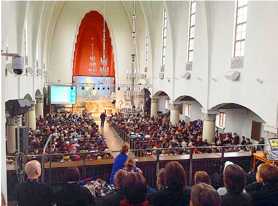
KOMMENTARERNA SPEGLADES på väggen i bakgrunden. Sammalagt kom det 638 kommentarer om olika saker under dagens lopp.