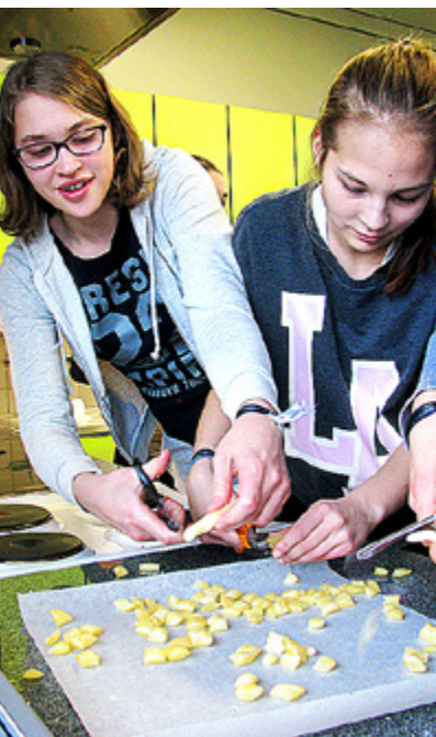
I EN verkstad tillverkades eget godis.