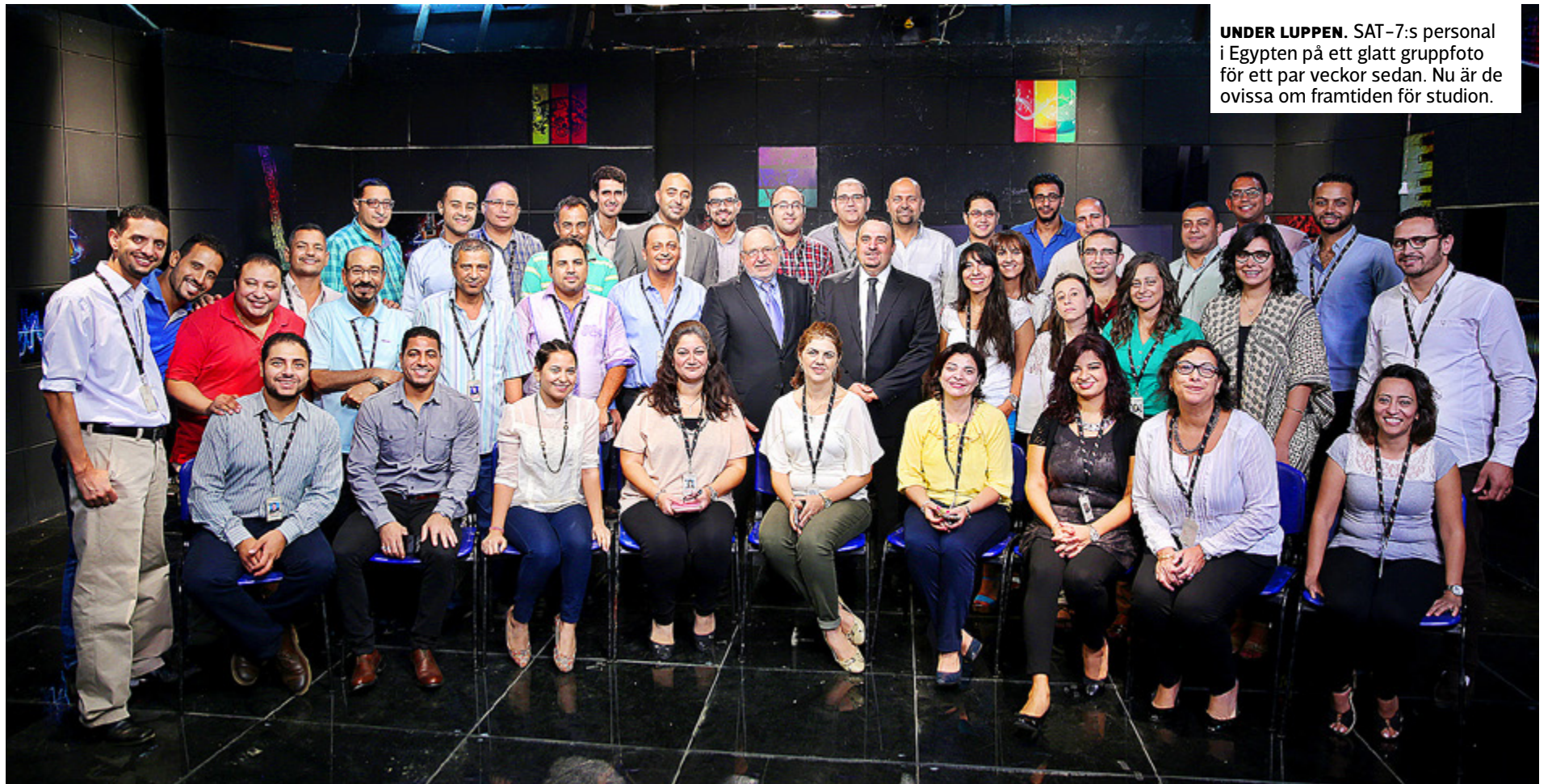
UNDER LUPPEN. SAT-7:s personal i Egypten på ett glatt gruppfoto för ett par veckor sedan. Nu är de ovissa om framtiden för studion.