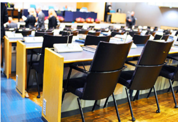
I FEBRUARI väljs nya ombud till kyrkomötet. Kyrkpressen rapporterar från kyrkomötets avslutande session på kyrkpressen.fi.

Vi rapporterar från det pågående kyrkomötet på kyrkpressen.fi.