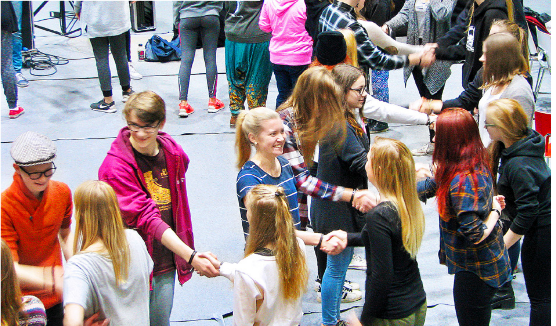
PÅ SPEEDFRIENDING-VERKSTADEN hade man möjlighet att träffa många nya människor.

UNG I KYRKAN. Kyrkpressen var med på ett av Svenskfinlands mest efterlängtrade veckoslut: Höstdagarna.