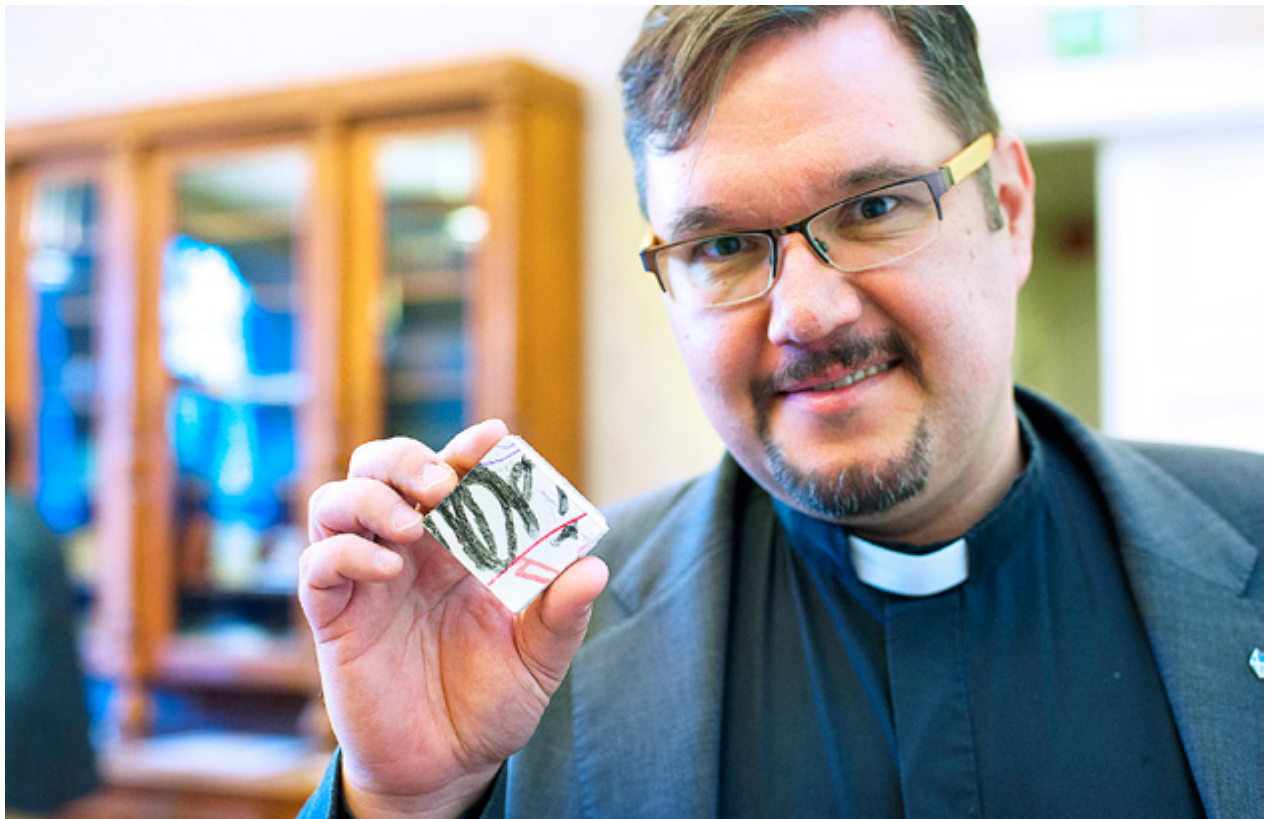
PÅ DRUMSÖ var församlingen tvungen att bygga en mellanvägg då lokalerna förvandlades till tillfällig flyktingförläggning. På väggen skrev folk in välkomsthälsningar. Nu är väggen sågad i bitar och bitarna till salu för gott ändamål.