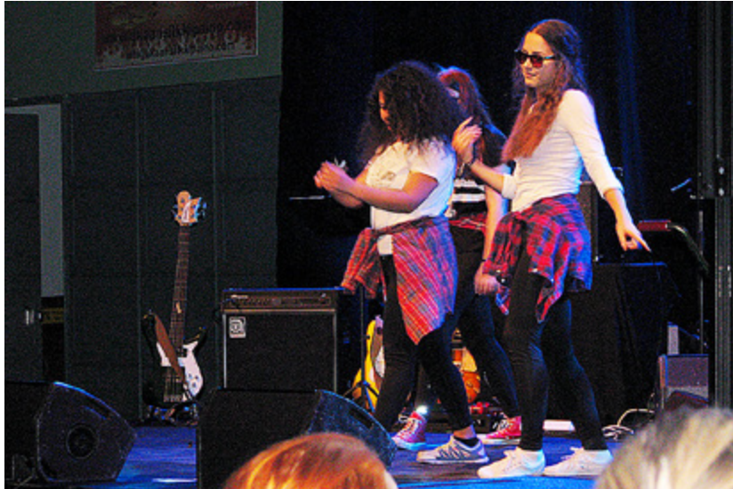
"HÖSTDAGSFUNK" med Petrus församling.