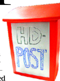
HÖSTDAGARNAS EGEN postlåda.

Årets Höstdagar levererade igen. Därför bjöd på ett intressant tema, fantastiska uppträdanden och mångsidigt program, och lämnade garanterat inte ett öga torrt. Nu börjar förberedelserna och väntan inför nästa år, men veckoslutet sädde frön till många djupa diskussioner. Vi fick också en rejäl dos mysiga kramar för att orka i vardagen – tills vi ses igen!