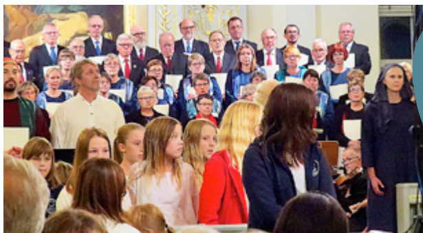
NÄRMARE 200 personer deltog i framförandet av Jeriko .

de följa med hur vattnet i Jordan följde naturens växlingar. Verket avslutades med en psalm där vi sjöng om målet