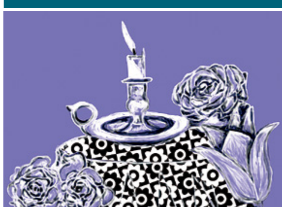
ILLUSTRATION: MATILDA EKMAN