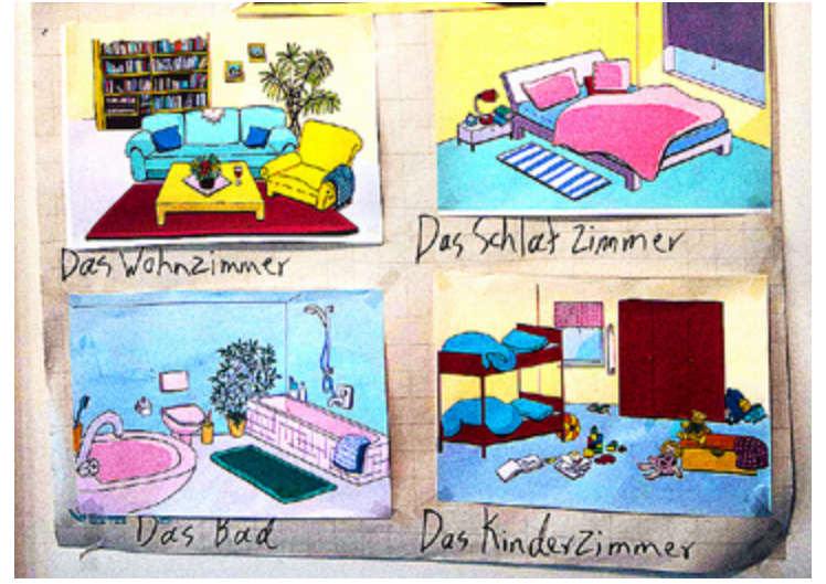
PÅ FÖRLÄGGNINGEN håller pensionerade lärare språkkurser.