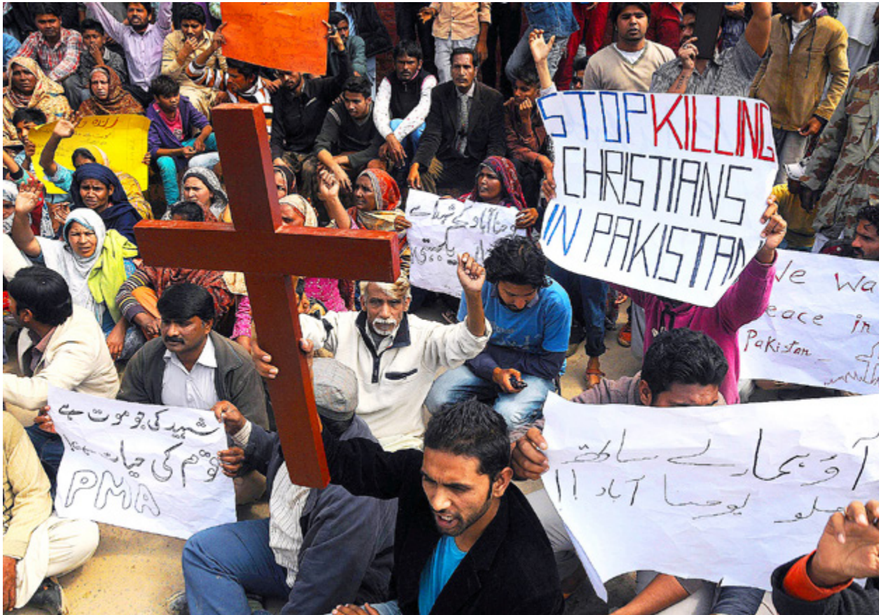
15 DÖDADES och 70 blev skadade när en självmordsbombare slog till mitt under söndagsgudstjänsten i en kristen kyrka i Lahore i våras. Dagen därpå gick kristna ut på gatorna för att demonstrera mot våldet mot kristna i Pakistan.