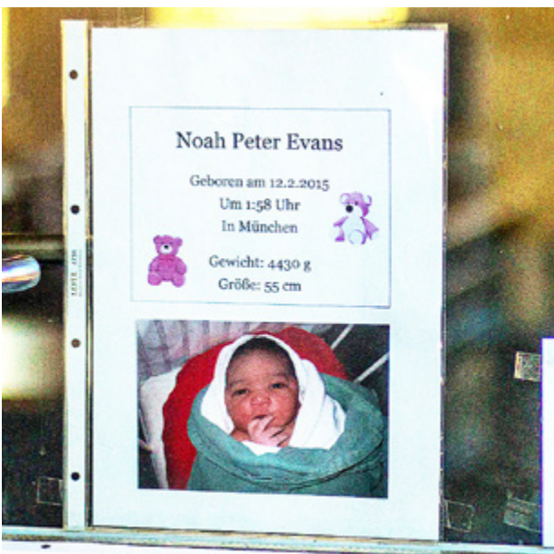
HITTILLS HAR tre barn fötts till föräldrar på flyktingförläggningen i Putzbrunn.