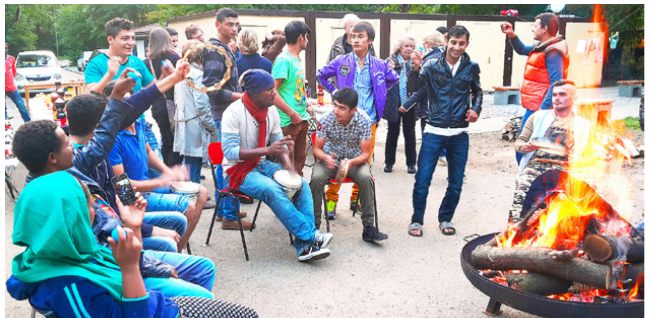
I NÖDINKVARTERINGEN Camp Moo i München har församlingens frivilliggrupp skaffat en eldstad som gör kvällarna mysigare.