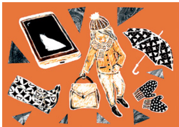
ILLUSTRATION: MATILDA EKMAN