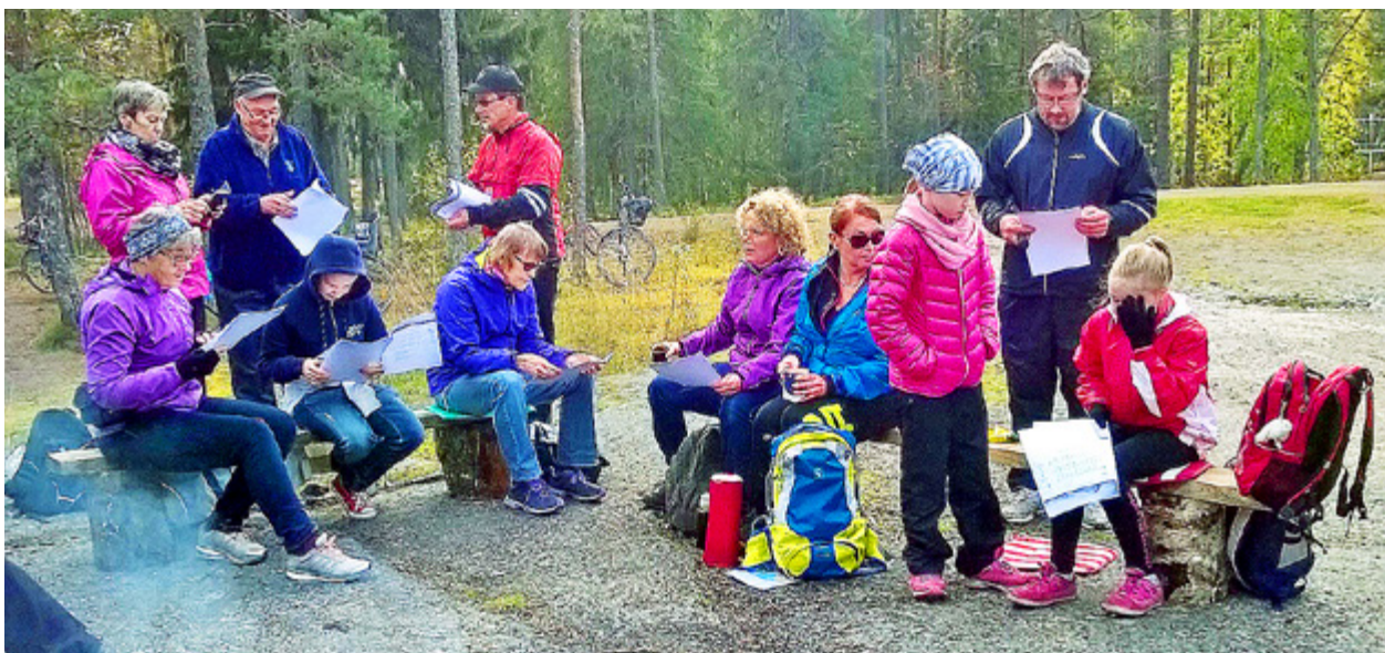
VID VILOPLATSEN kunde man grilla korv och sjunga psalmer.

Kyrkpressen/opinion Sandvikskajen 13, 00180 Helsingfors E-post: redaktionen@kyrkpressen.fi Insändare måste förses med skribentens namn samt för redaktionens bruk även adress och telefonnummer. Anonyma inlägg accepteras endast i undantagsfall. Obs! Insändarnas längd är högst 1 200 tecken. Redaktionen förbehåller sig rätten att förkorta insändarna. Insänd text returneras inte.