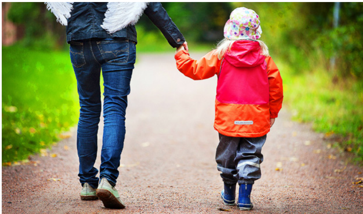
KYRKAN HAR välkomnat småbarn i sin klubbverksamhet i 70 år.