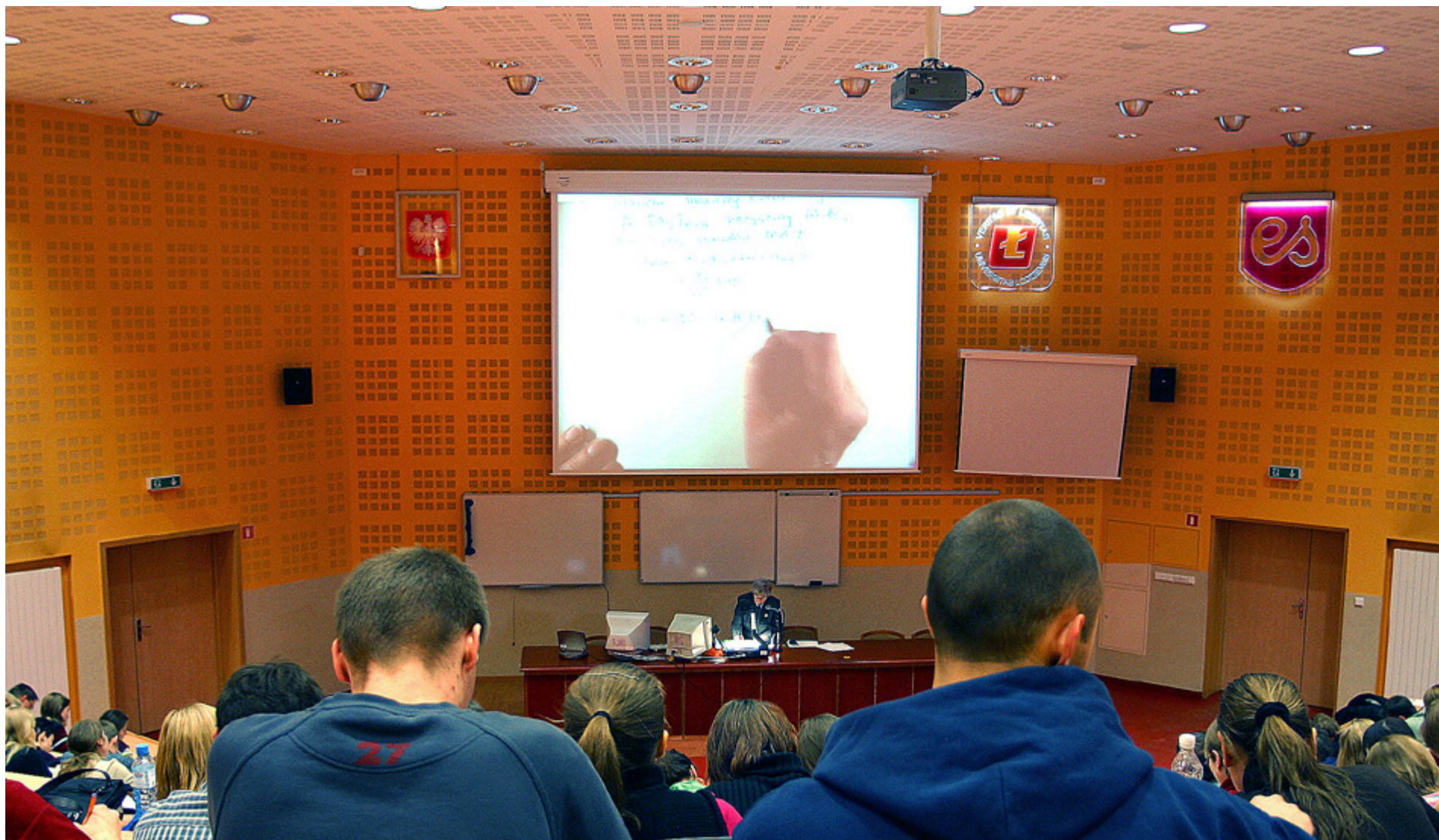
MOBBNING ÄR ett mänskligt problem. Det försvinner inte förrän vi jobbar för en kultur där det egna illamåendet kan bearbetas.