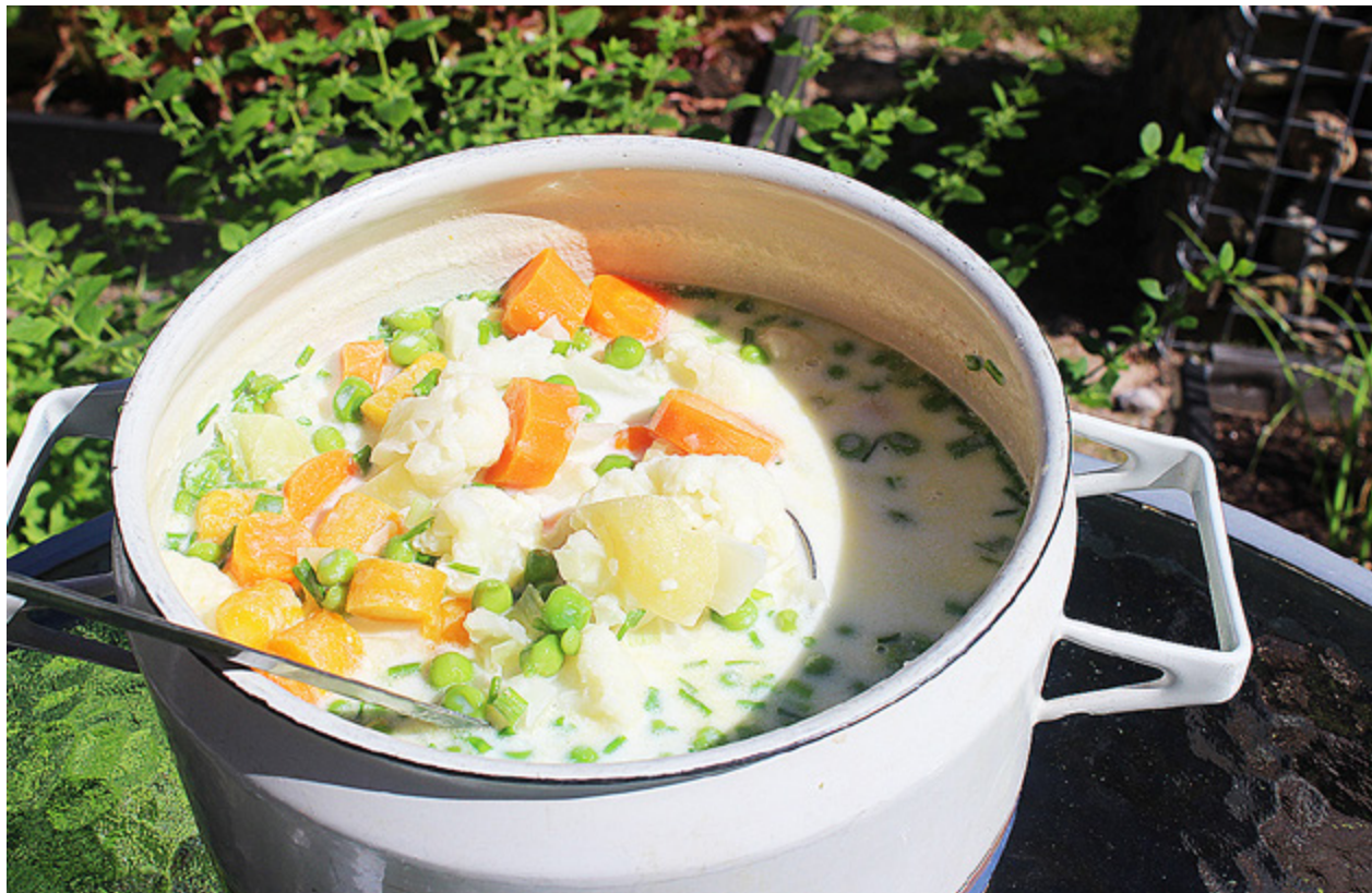
ÄNGAMAT KALLAS snålsoppa av sina belackare men gjord på primörer är den sommarmat av finaste slag.