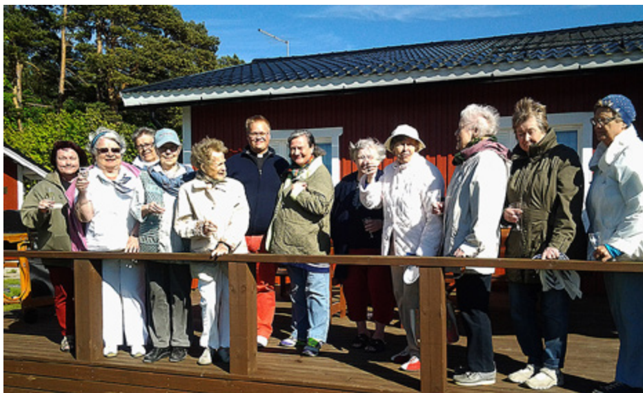
JOHANNES FÖRSAMLINGS pensionärläger ordnades 8-12 juni. Fotot är taget under grillkvällen vid Labbnäs bastu.

Det kom att bli en fin, livsbejakande och gripande vistelse för oss tio deltagare och våra tre ledare. Veckan var solig men det blåste ordentligt över Dragsfjärdssjön. Härliga försommarfärger, knallgrönt gräs, blå himmel över den underbart vackra gården som har en lång historia.