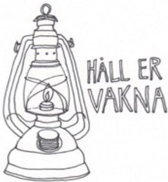
ILLUSTRATION: MARIA EKLUND