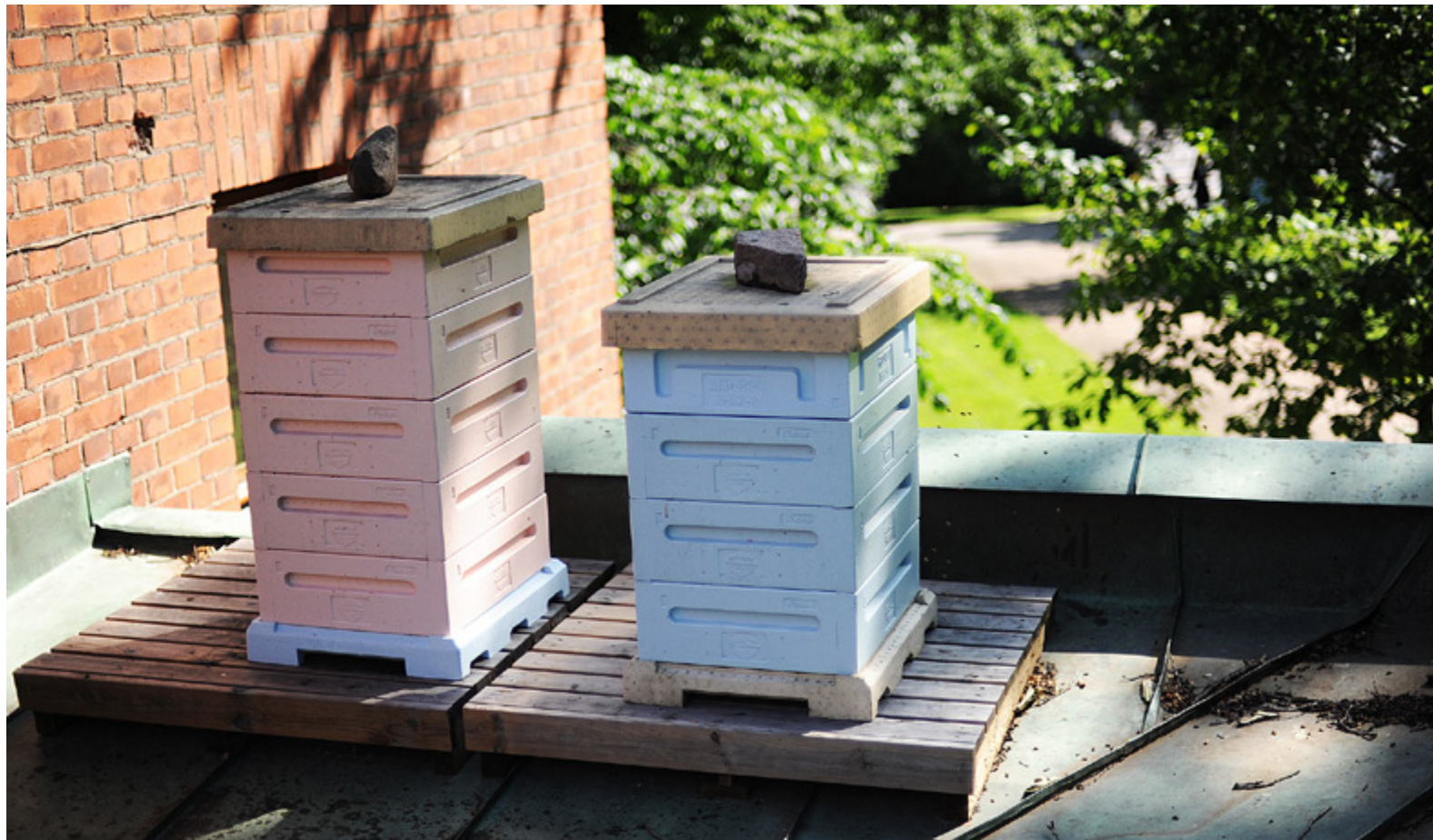
BINA MÅR bra mitt i stan, långt från bekämpningsmedel och gödsel. Närmare än så här vågade inte fotografen gå utan skyddsutrustning.