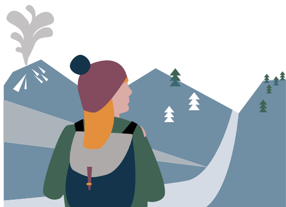
ILLUSTRATION: LINA LÖFQVIST