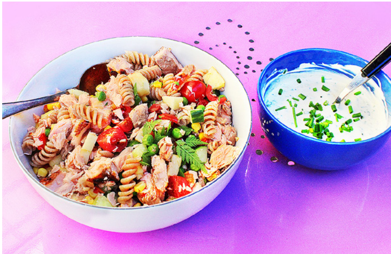
ÅTERANVÄNDNINGSSALLADEN PASSAR bra också på sommaren. Salladen har fått sig några gröna stänk av spansk körvel.