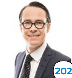
202 Haglund Carl försvarsminister, ekon.mag. Esbo