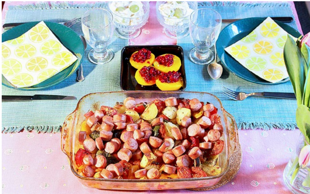
ATT SERVERA persika med lingon som tillägg är ett tips jag plockat upp från en restaurang som serverade polsk mat.