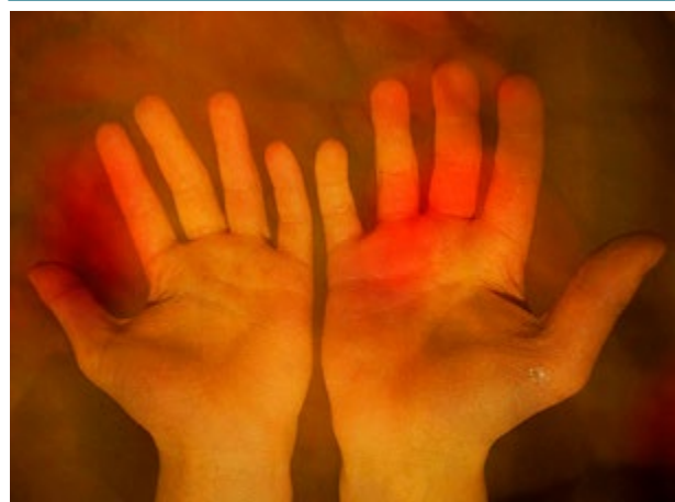
ILLUSTRATION: MARIA FORSBLOM