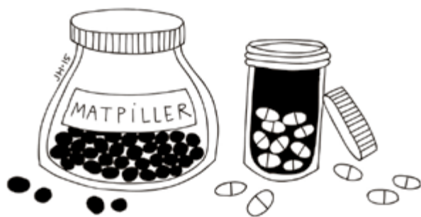
ILLUSTRATION: JOHANNA HÖGVÄG