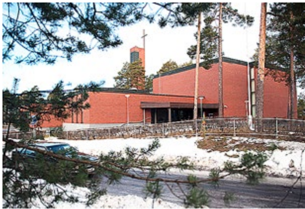
YXPILA KYRKA finns på Karleby kyrkliga samfällighets lista över fastigheter som kan säljas eller hyras ut.

Sley hyr redan en tidigare kyrksal i Helsingfors, Lutherkyrkan, som under de senaste 20 åren varit nattklubb. Den ska återuppstå som kyrka i fastigheten som ägs av ett försäkringsbolag.