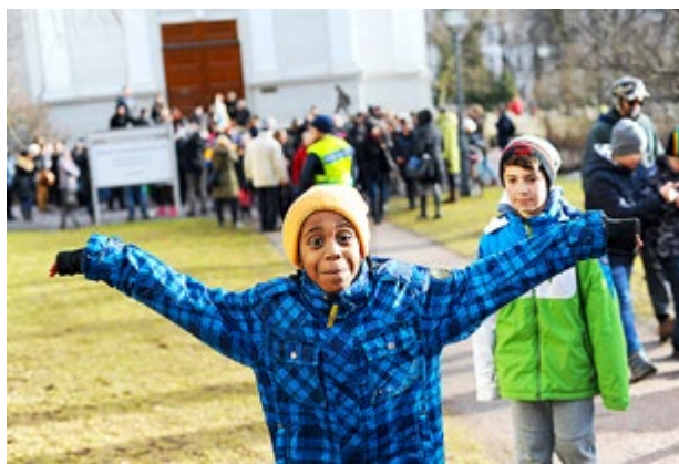
OMKRING HUNDRA personer gick promenaden för vänskap och fred i Helsingfors.

pet röra sig mot Gamla kyrkan på Bulevarden. Fotograf och journalister ansluter sig till vänskapspromenaden, och det bildas långa köer längs med trottoarerna. Polisuppbådet är stort, men allt går lugnt till. Alla människor, med olika religioner och övertygelser, har välkomnats att gå med i promenaden hand i hand.