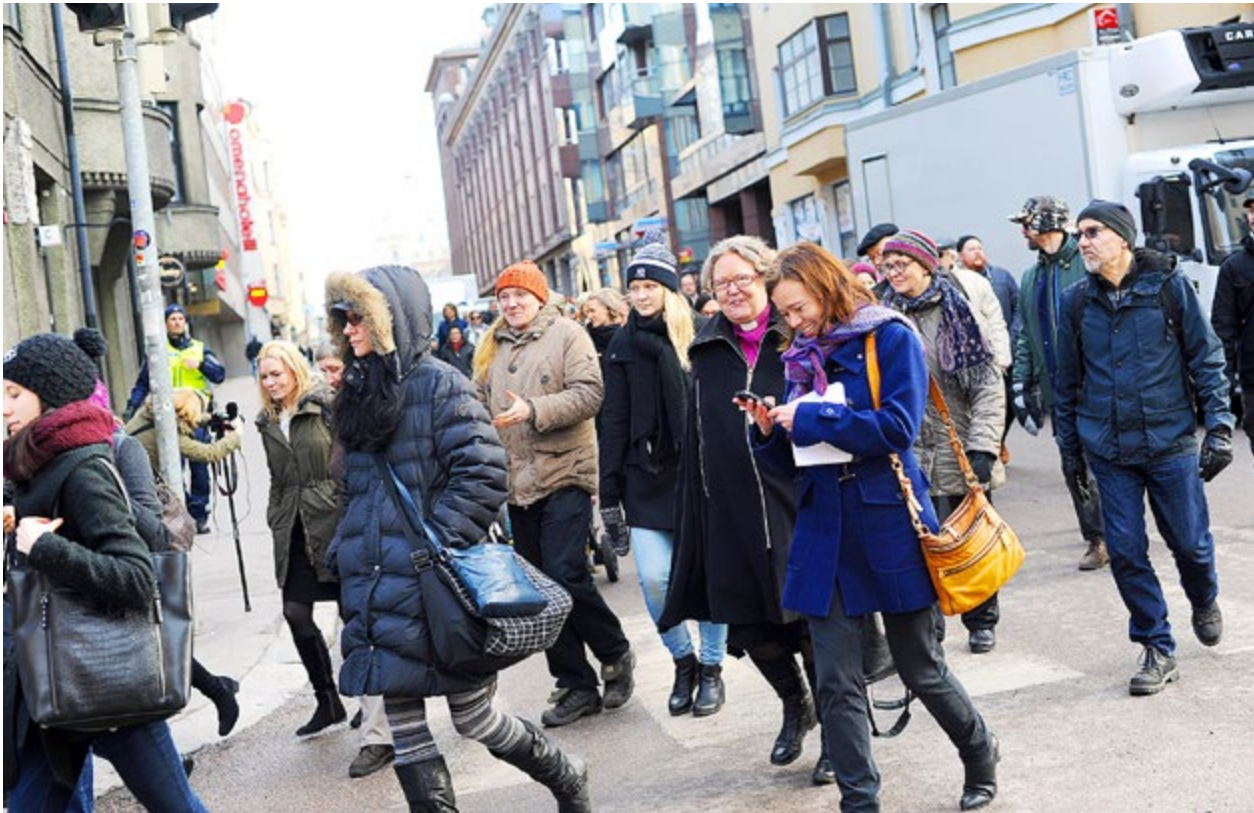
POLISEN SPÄRRADE av gator så att deltagarna kunde promenera från Gamla kyrkan på Bulevarden till synagogan i Kampen längs med fordonsfilerna.