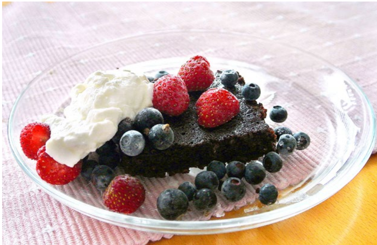
DET VIKTIGASTE med en god kladdkaka är konsistensen, så se till att inte grädda den för länge.