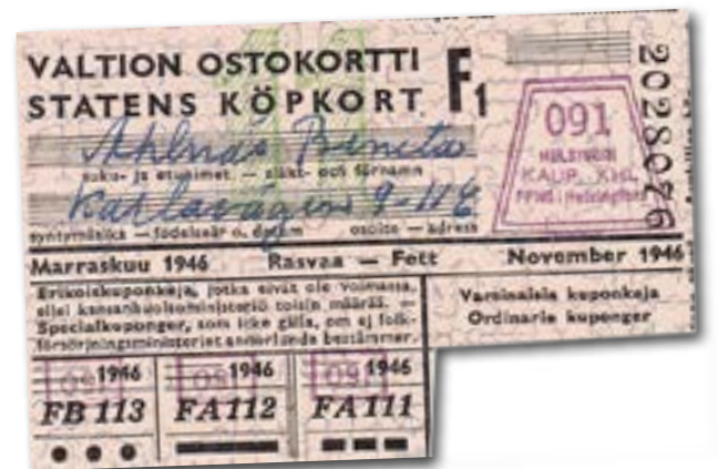
PÅ 40-TALET inhandlades stora delar av den mat som skulle stå på julbordet med ransoneringskort.

allra bästa". Det kunde ha gått riktigt illa. De kände stor tacksamhet!