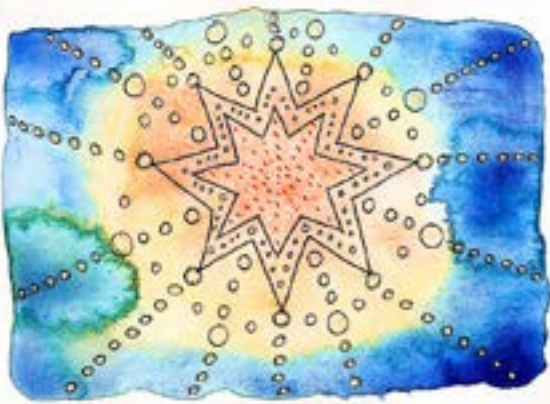
ILLUSTRATION: FILIPPA HELLA