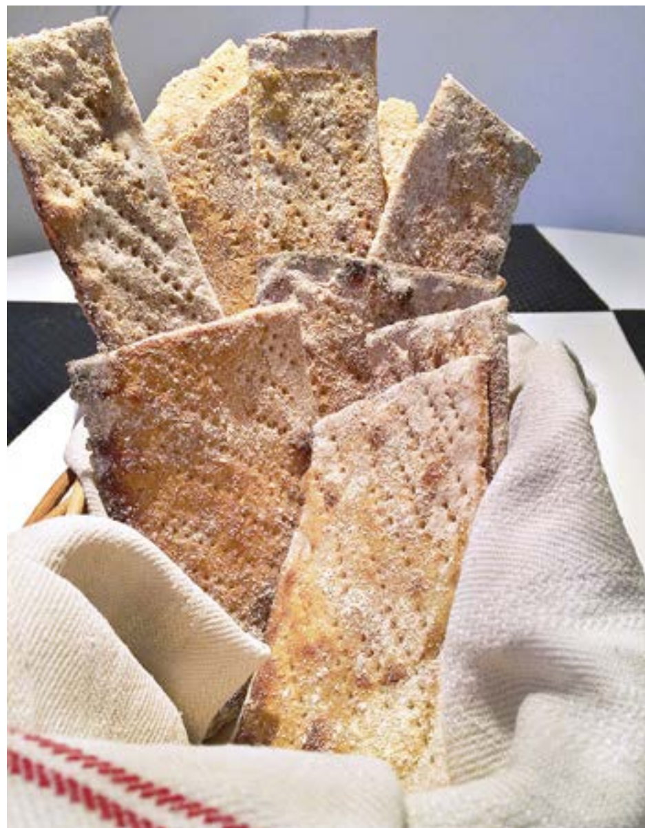
MED DET här receptet får du ett härligt julknäckebröd som räcker till hela helgen.

ka ut degen sätter du ugnen på 225 grader. Nu kan du även ta fram en kast-rull eller stekpanna som du ska använda till att rosta lite kornmjöl i. Rostningen går till så att du låter pannan bli het och sedan håller du i mjölet, inget annat. Rör om med jämna mellanrum så ser du att mjölet börjar ändra färg och får en lite mörkare nyans. Du kan själv bestämma hur länge du vill rosta, men du kan känna på lukten när mjölet blivit färdigt.