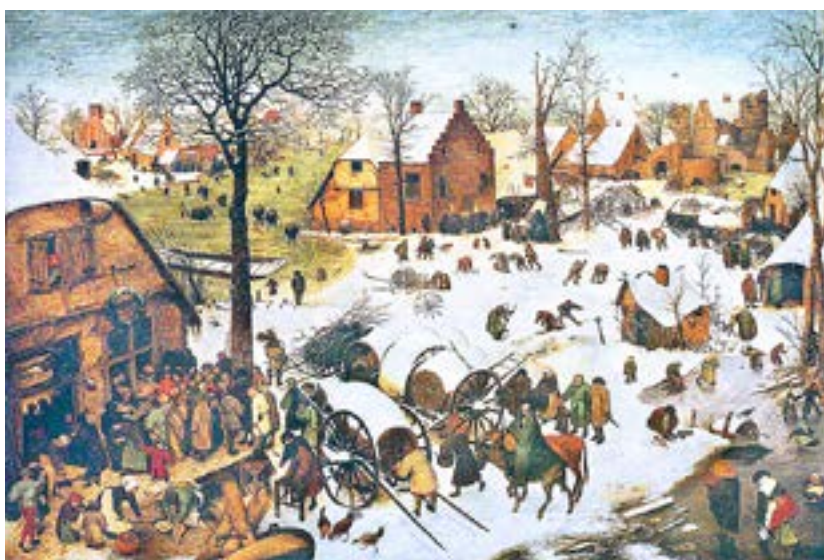
TIDSTRANSPONERAD FOLKRÄKNING. Renässansmålaren Pieter Bruegel valde att förlägga Josef och Marias resa till Betlehem till sin egen samtid.

– Det tredje är den kristna trons uppståndelsehopp. Det finns mer än