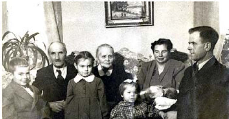
FAMILJEN BARSAS. Julens förberedelser började redan på hösten på bondgården i Råfsby, Östra Nyland. Förberedelserna kan du läsa om på www.kyrkpressen.fi .