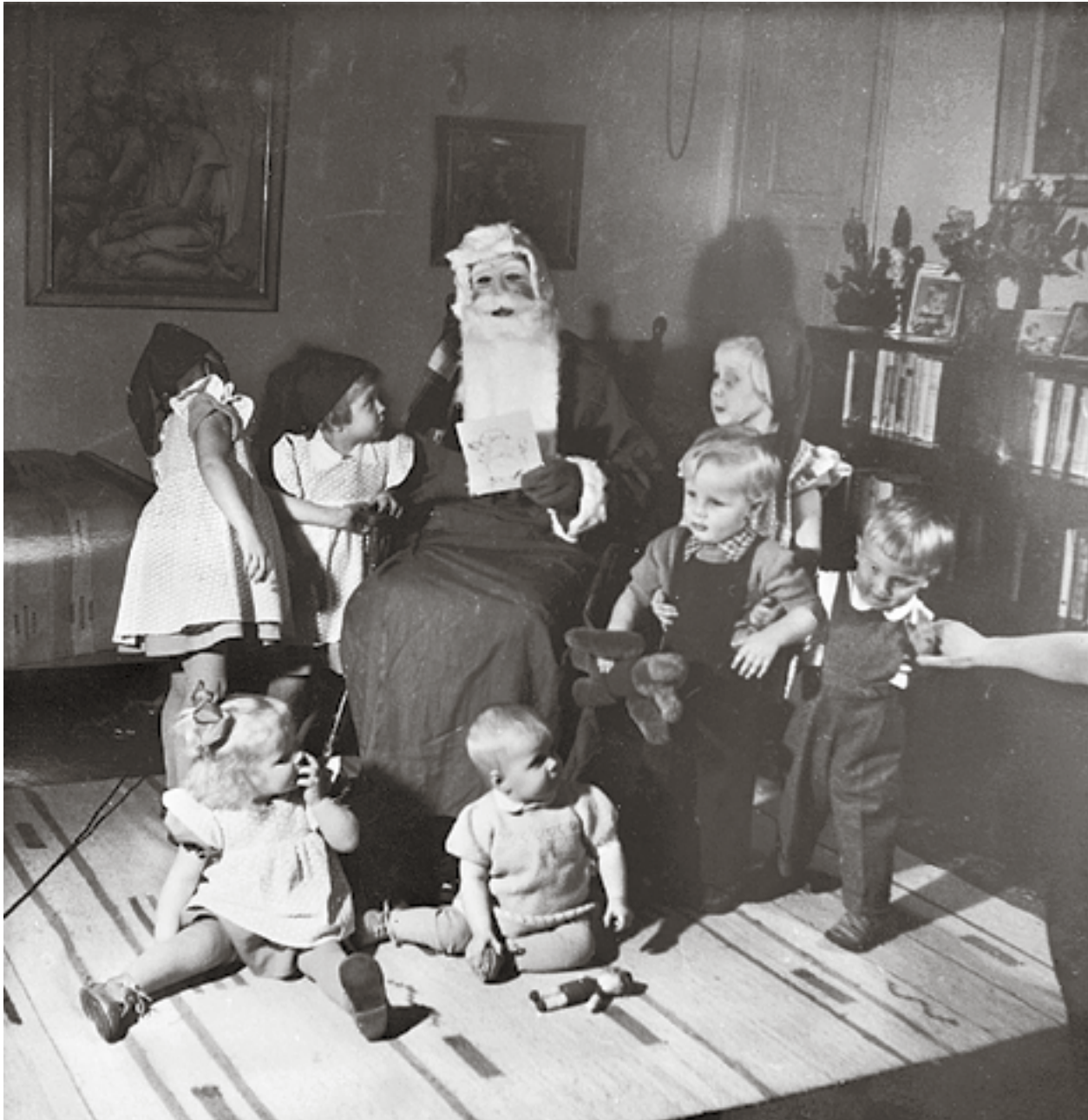
JULAFTON I Åbo i början av 1950-talet.