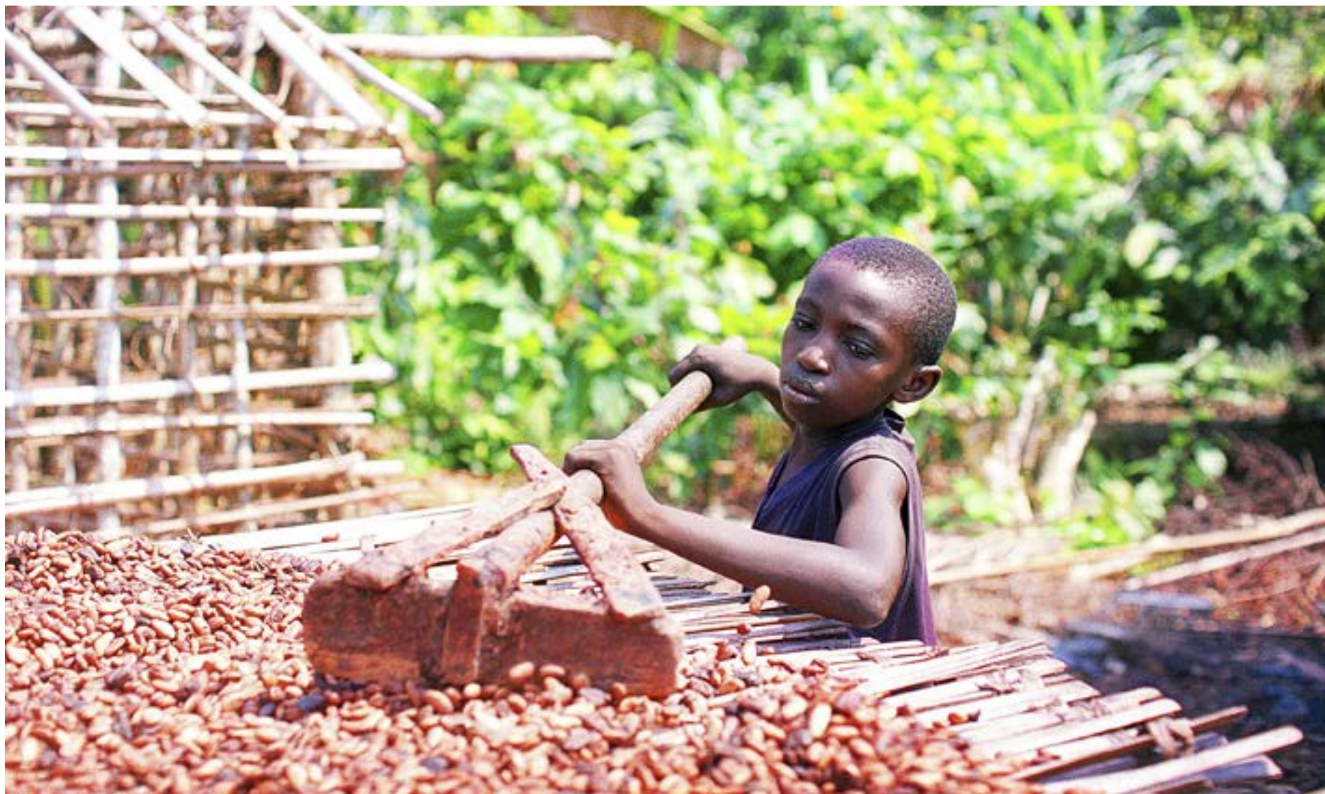
MER ÄN 70 procent av världens kakaoproduktion kommer från de västafrikanska länderna Elfenbenskusten och Ghana. Barnen blir exponerade för kemikalier, långa arbetsdagar och de har ingen möjlighet att gå i skola. De låga inkomsterna för småbrukare tvingar familjerna att ta med barnen i arbetet på odlingarna.