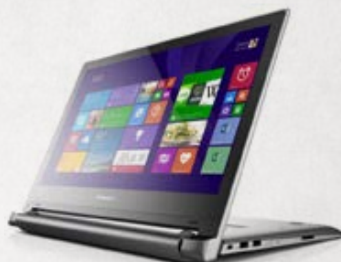
LENOVO IdeaPad Flex* 14D 14" HD MULTI-TOUCH | AMD A4-5000 | 4GB RAM | 500GB Windows 8.1