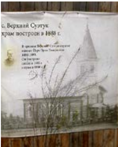
KATEKET LINDHOLM och kyrkan.