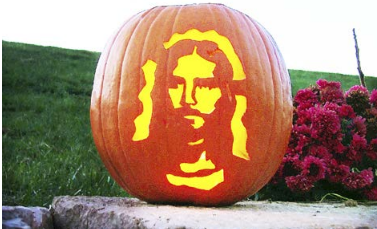
TRADITIONEN ATT fira Halloween kom ursprungligen från Europa och inte USA, som många kan tro.