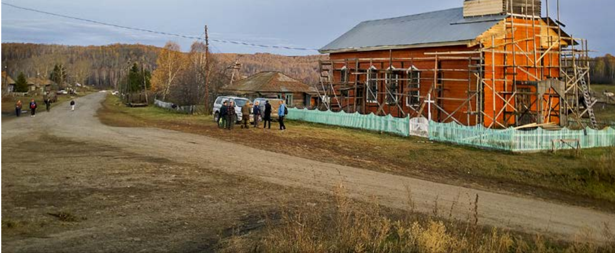
CIRKELN SLUTS. Österbottningar tog initiativet till kyrkbygget i Suetuk på 1880-talet och österbottningar renoverar kyrkan 130 år senare.

MISSION. I den lilla byn Suetuk i östra Sibirien står en kyrkbyggnad som uppfördes för att betjäna de finländska fångar som förvisades hit. Byggnaden är den enda lutherska kyrkan i Sibirien som fortfarande står kvar på sin ursprungliga plats. Nu genomgår den en renovering, helt med frivilliga krafter. Kyrkpressens redaktör reste med ett österbottniskt talkogäng.