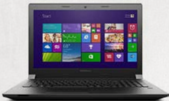
LENOVO B50-45 15.6" HD AntiGlare AMD E1-6010 | 4GB RAM | 500GB hårddisk | Windows 8.1

* Lenovo Flex är en unik, tunn och lätt bärbar dator med dubbla lägen som kan vikas 300 grader från bärbart läge till stående läge, ett perfekt sätt att titta på filmer under resan eller få ut det mesta av pekskämsprogram.