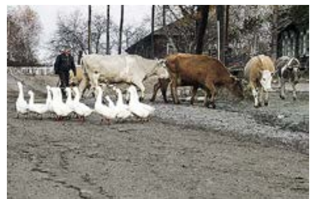
RUSNINGSTRAFIK PÅ byavägen.

– Det var ju klart från första början att vi skulle arbeta i Suetuk. Kyrkbyg-