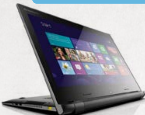
LENOVO IdeaPad Flex* 15D 15.6" AMD A4-5000 | 4GB RAM | 500GB | Windows 8.1