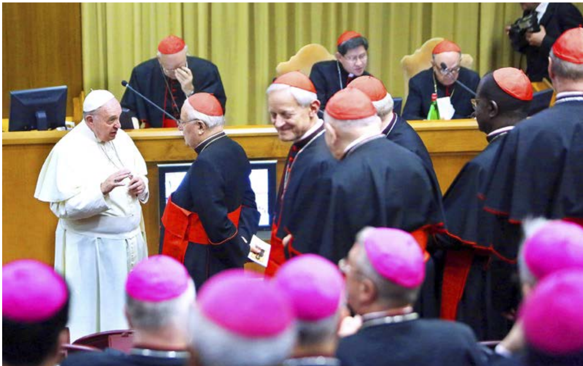
KATOLSKA KYRKANS synod för familjen visade att det finns klyftor mellan biskopar och lekmän av olika falanger. Katoliken Emil Anton påminner om att påven Franciskus har sista ordet, men han vill ge rum för en öppen diskussion.