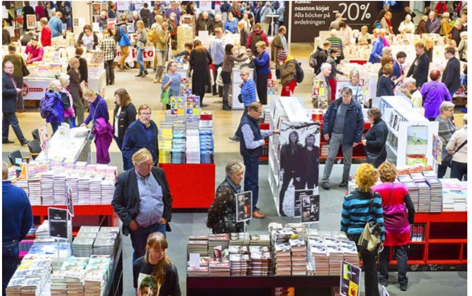
FLERA UPPSTÄLLDA kandidater i församlingsvalet var vidtalade att leda eller delta i programpunkter på bokmässan i Helsingfors. Så blev det ändå inte.