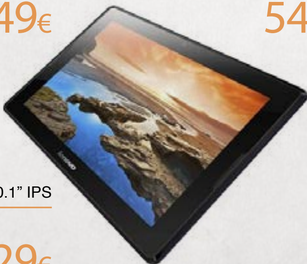
LENOVO IdeaTab A7600-H 10.1" IPS 16GB | WiFi+3G | Android 4.2