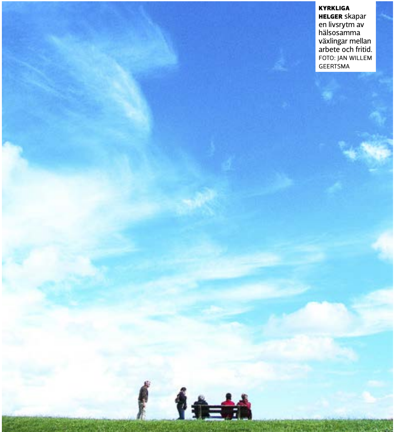
KYRKLIGA HELGER skapar en livsrytm av hälsosamma växlingar mellan arbete och fritid.

Informationsgången om den gemensamma utredningen