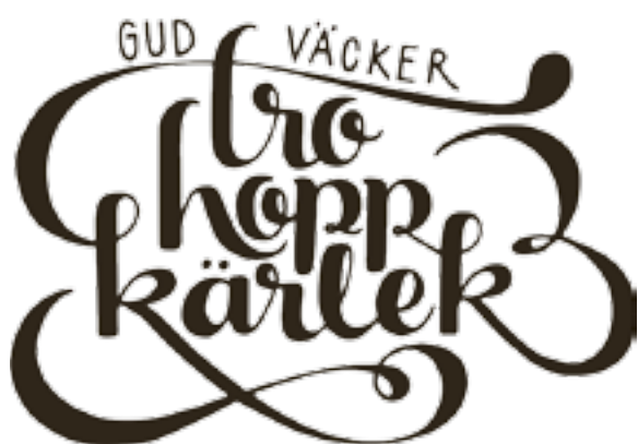
ILLUSTRATION: SOFIE BJÖRKGREN-NÅSE