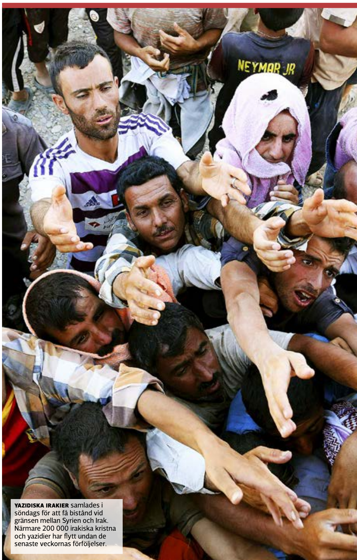
YAZIDISKA IRAKIER samlades i söndags för att få bistånd vid gränsen mellan Syrien och Irak. Närmare 200 000 irakiska kristna och yazidier har flytt undan de senaste veckornas förföljelser.