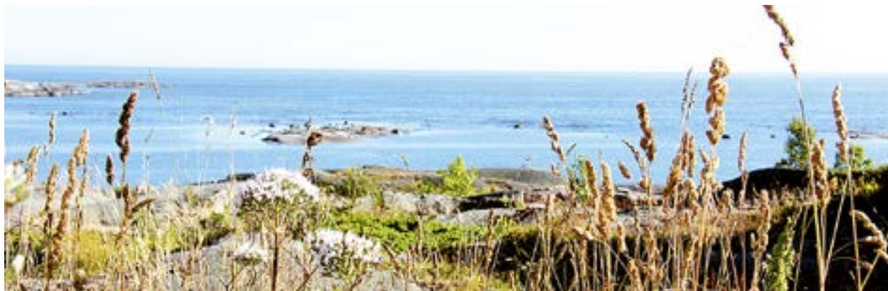
UTÖ ÄR Finlands sydligaste bebodda ö. Samhället här har i långa tider påverkats av havets närvaro.