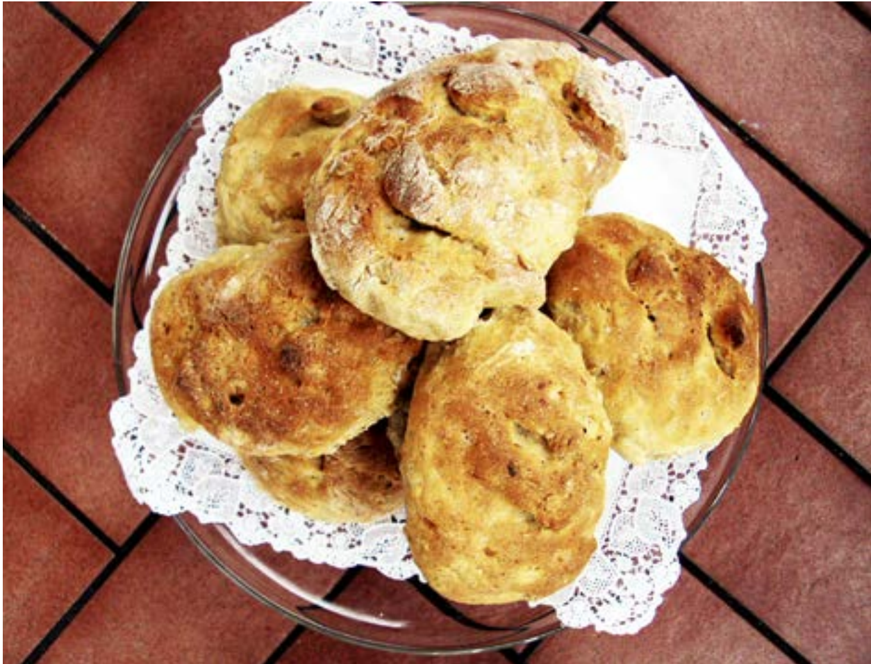
MOROTSSEMMLOR FYLLDA med vetekli, solrosfrön och linfrön gläder både kropp och själ.