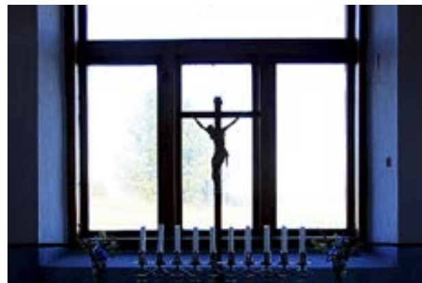
PÅ ALTARET i Utö bönehus står en tioarmad ljusstake som en påminnelse om julnatten 1947 när S/S Park Victory förläste utanför Utö.

UTÖ. Havet öppnar sig framför det lilla skärgårdssamhället i yttersta havsbandet. Den röd vita fyren, som i århundraden har guidat sjöfarare rätt, är öns kännetecken. I dessa vatten förläste bland annat Estonia och S/S Park Victory. Det är inte utan orsak som vattnen kring Utö har kallats för en skeppskyrkogård.