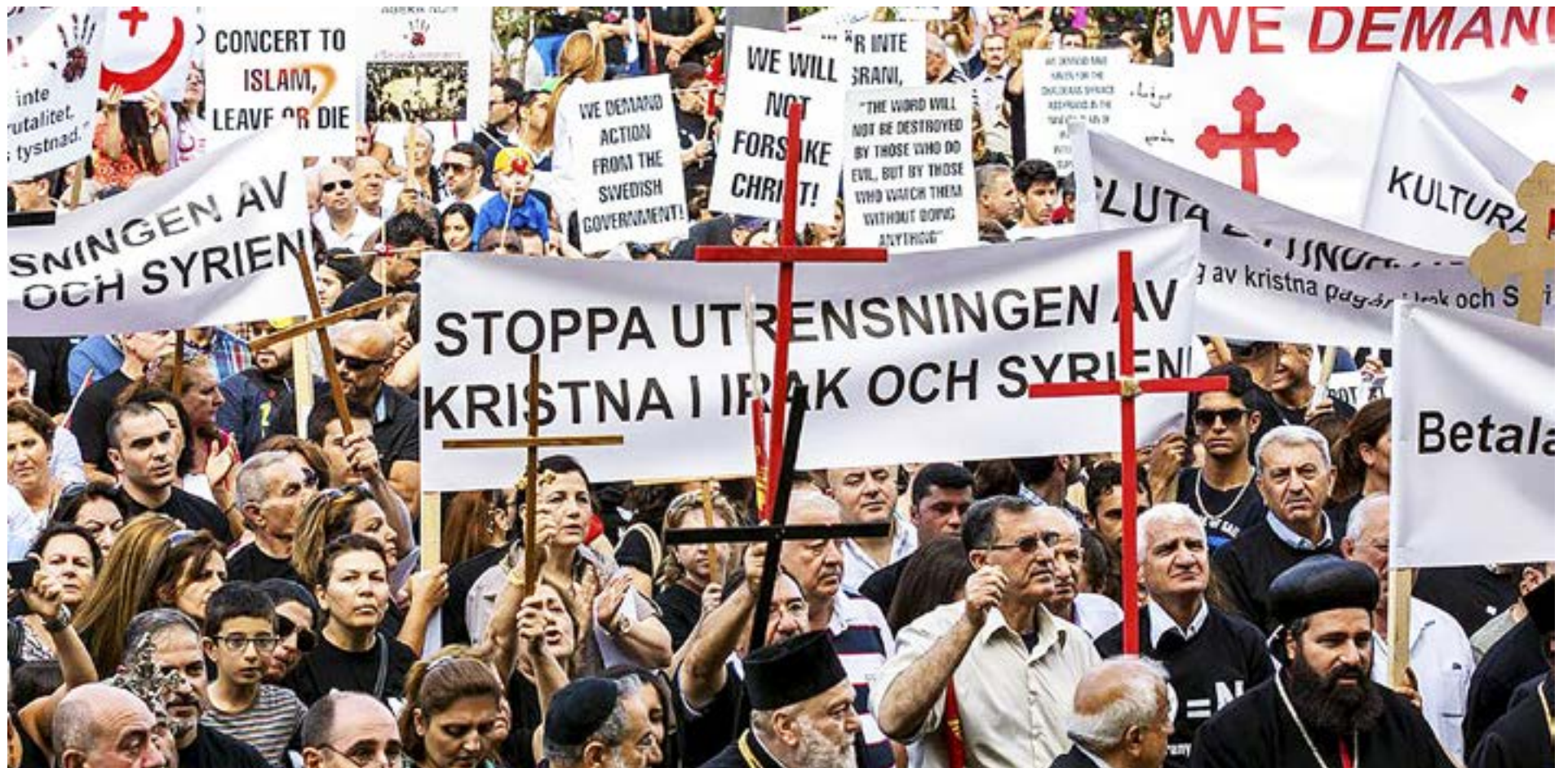
TIOTUSEN SAMLADES på Medborgarplatsen i Stockholm i söndags till en stödaktion arrangerad av Kommittén för Mellanösterns kristna. De vill fästa uppmärksamheten på Islamiska Statens etniska utrensningar i Irak och Syrien.