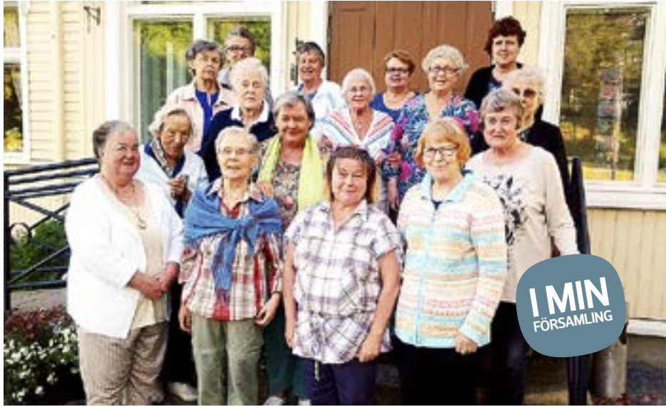
DELTAGARNA I Johannes församlings pensionärsläger samlade till gruppfoto.

En dag var det loppis på Labbnäs. Vi hittade nog al-