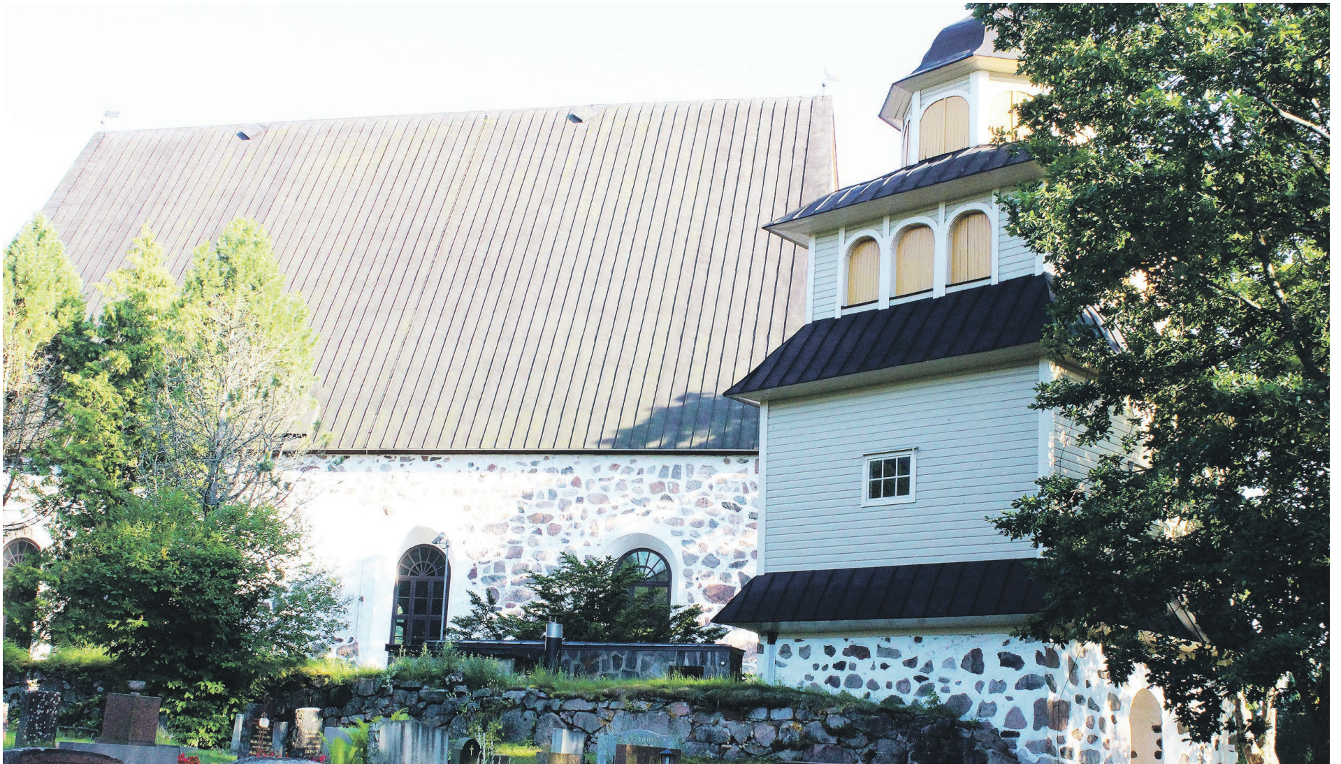
GRÅSTENSKYRKAN I Sjundeå är från 1480 och församlingen äldre än så. I Sjundeå finns det opinion för samgång både i riktning Kyrkslätt, Lojo och Ingå.