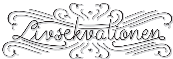
ILLUSTRATION: SOFIE BJÖRKGREN-NÅSE