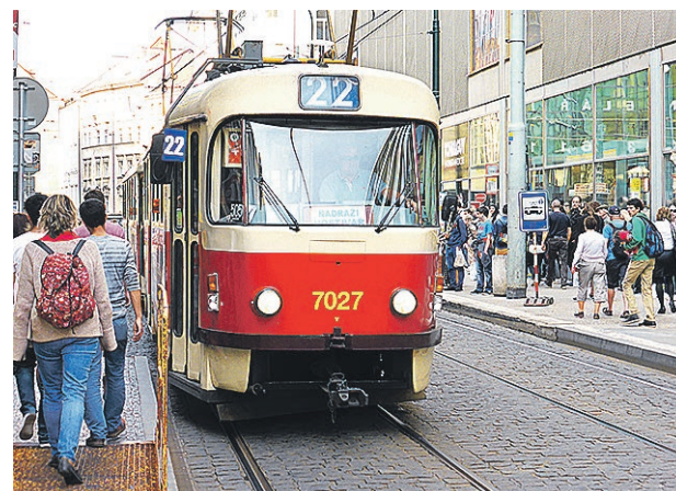
LIKT HELSINGFORSARNA åker Pragborna gärna spårvagn. Nummer 22 går från centrum upp till Pragborgen.

– Runt oss fanns bara tomhet, lögner och åter lögner. Som många unga sökte jag meningen med livet i konst, litteratur, natur, förhållanden och inte minst alkohol. Ändå var allting grått.