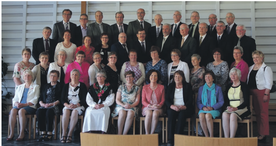
43 AV 1964 års konfirmander mötte upp till återträff i Karleby, många tillsammans med man eller hustru.