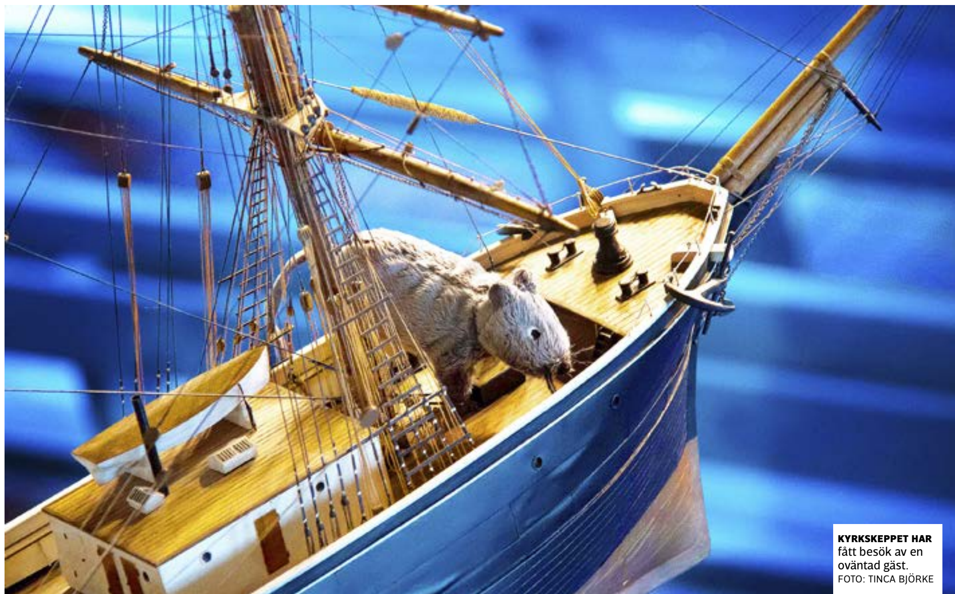
KYRKSKEPPET HAR fått besök av en oväntad gäst.

Lilla Jonny's nya babybror ville inte somna utan skrek för fulla muggar medan mamma försökte vaggga honom till sömns. Jonny tittade förundrat på och frågade sin mamma: Varifrån kom han? – Han kom från himlen, svarade mamma. – Mow jag kan förstå varför de slängde ut honom! sade Jonny.