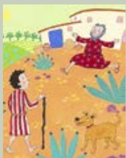
BILD UR BIBELBERÄTTELSE FÖR BARN I NORDEN. ILLUSTRATÖR: NADJA SARELL.

Gud är en nådig fader. Han söker syndaren och förlåter. I himlen gläder man sig över varje förlorad som blir funnen.