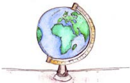
ILLUSTRATION: JOSEPHINE MICKELSSON