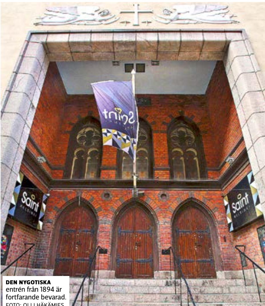
DEN NYGOTISKA entrén från 1894 är fortfarande bevarad.

Även om Sley och Slef tidigare ägde fastigheten tillsammans har Slef ingen del i hyresavtalet.