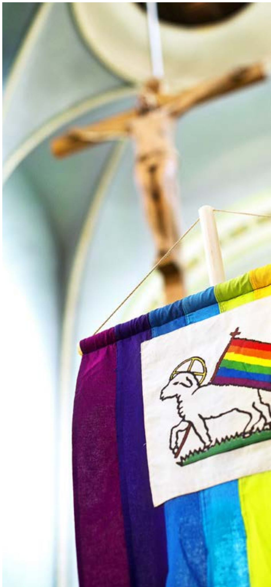
TEMAT FÖR Prideveckan i Helsingfors var i år arbetslivet. Därför diskuterades det också hur det är att vara homosexuell och jobba inom församlingen.